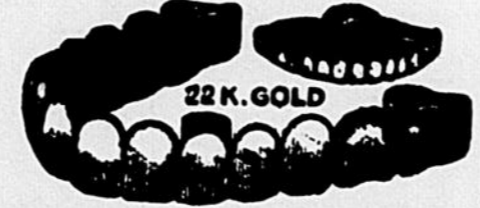
Nous posons aussi les dents sans palais d'après les méthodes les plus modernes.

Dentistes diplômés seulement des plus grandes universités de Boston, New York, Chicago et Philadelphie ainsi que du McGill et de Laval.