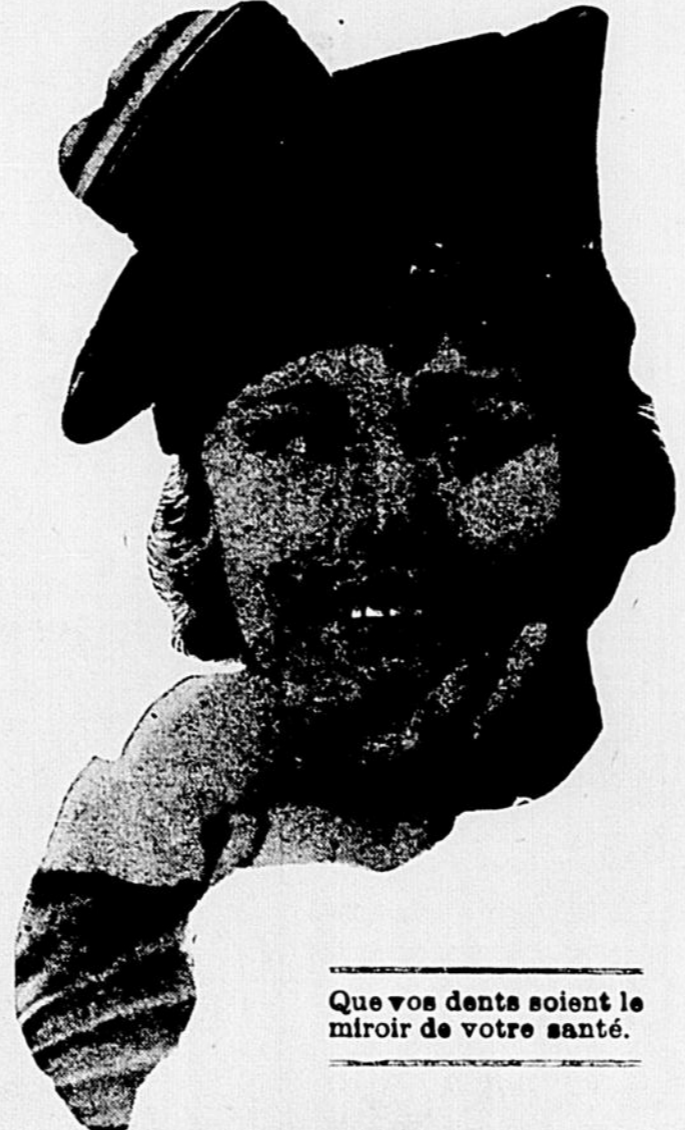
Que vos dents soient le miroir de votre santé.