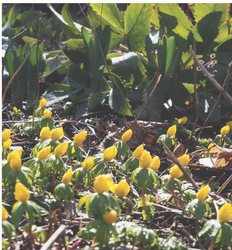
Colonie de hellébore d'hiver

La plupart des petits bulbes printaniers ont la faculté de se pérenniser et de former de belles colonies qui ensoleillent le jardin dès les premières douceurs. Ici, une colonie de gloire des neiges.