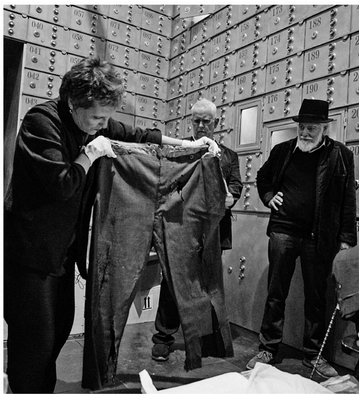
Déballage du pantalon porté par Charlie dans The Kid , en présence de deux de ses fils, Eugene et Michael. À droite: Chaplin écrivant ses mémoires au manoir, 1964. Ci-dessous: Charlot dans City Lights .