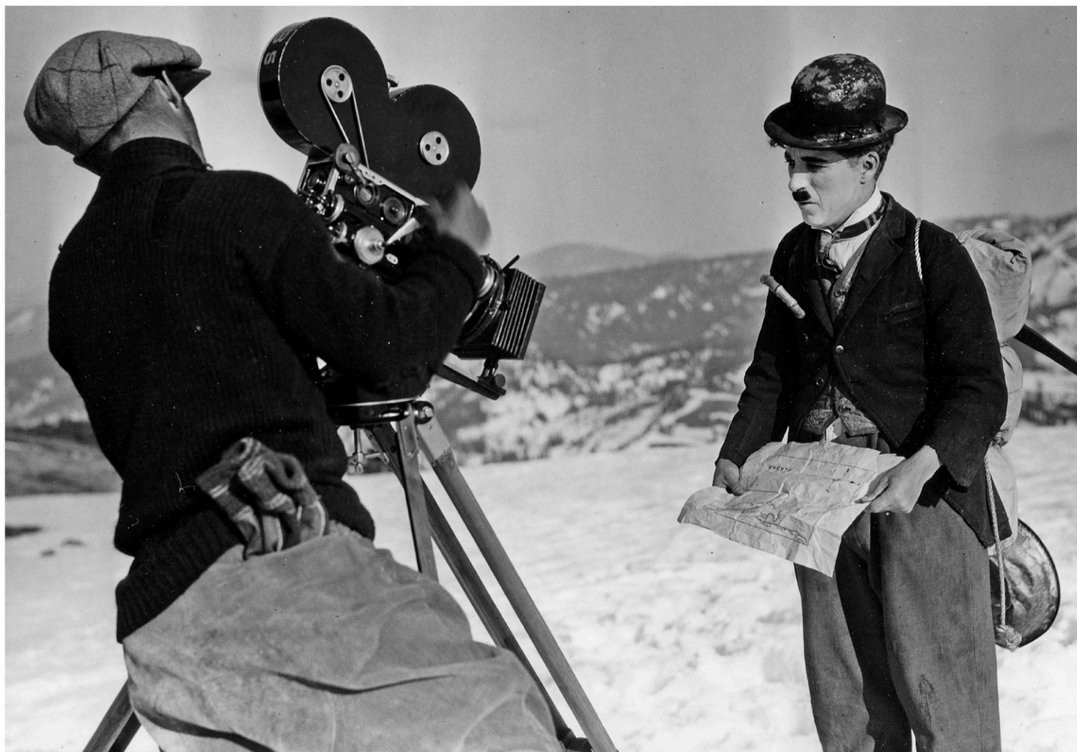
Chaplin sur le plateau de tournage de Gold Rush .