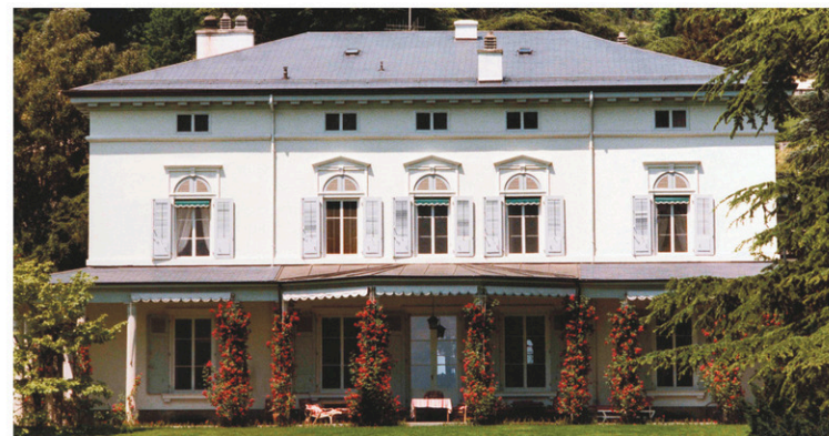
Le Manoir de Ban vu du jardin, 1977. Bâti en 1840, il a retrouvé son enveloppe d'origine, le concepteur n'ayant pris que quelques libertés à l'intérieur pour de louables motifs muséologiques.