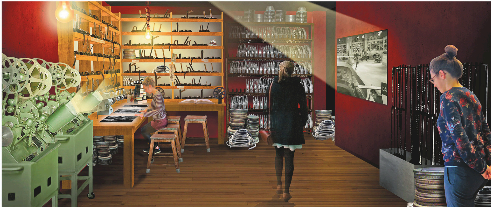
Scénographie du studio « Secrets de fabrication », une des pièces du musée.

C'est là que le concepteur Yves Durand en-