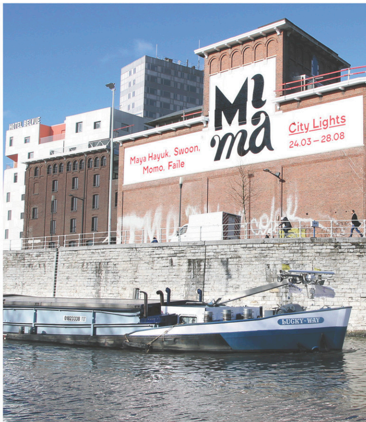
Le MIMA occupe un lieu emblématique du quartier industriel Molenbeek, qui veut renaître de ses cendres envers et contre tous.

Ce voyage de presse comportait des volets art, culture, mode, design, architecture et