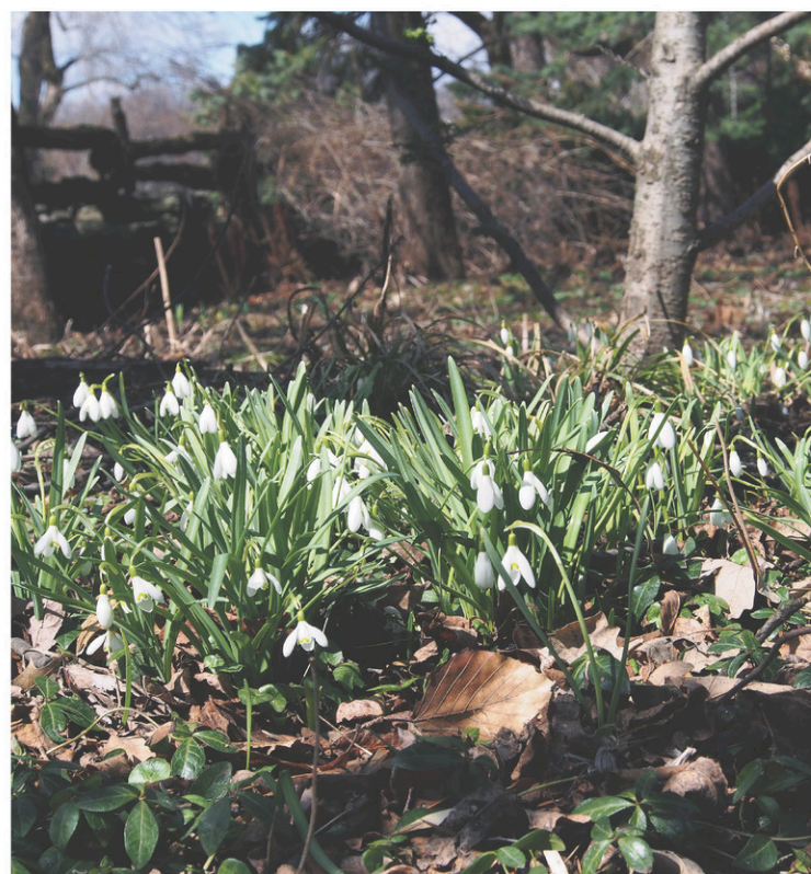
Colonie de perce-neige

Certains arbustes, comme les potentilles, les seringat, les cornus, s'ils ont été particulièrement négligés, peuvent être taillés de façon draconienne en les rabattant à 10 à 15 centimètres du sol. Cette technique se nomme le recépage. Toutefois, attention, pour