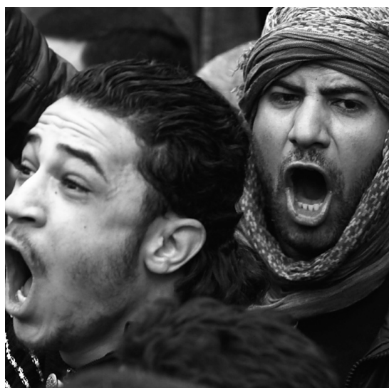
Des manifestants hier, à Alexandrie

Durant la phase ascendante de l'État national, les aspirations personnelles à la liberté et l'aspiration collective à l'indépendance et au développement s'enchevêtrent. L'individu y gagne un sentiment de «plus-être», une dignité exaltante, qu'il partage avec l'ensemble de ses concitoyens. Mais il accepte en contrepartie, au