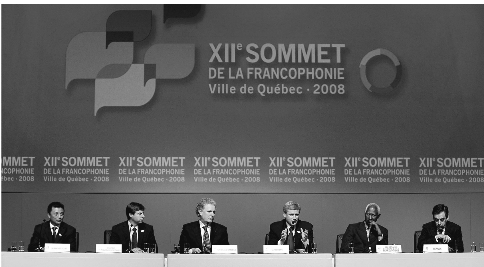
Le Sommet de la Francophonie de 2008, qui s'est tenu à Québec au moment où éclatait la crise économique et financière mondiale, a constitué le premier forum de débat Nord-Sud en la matière.