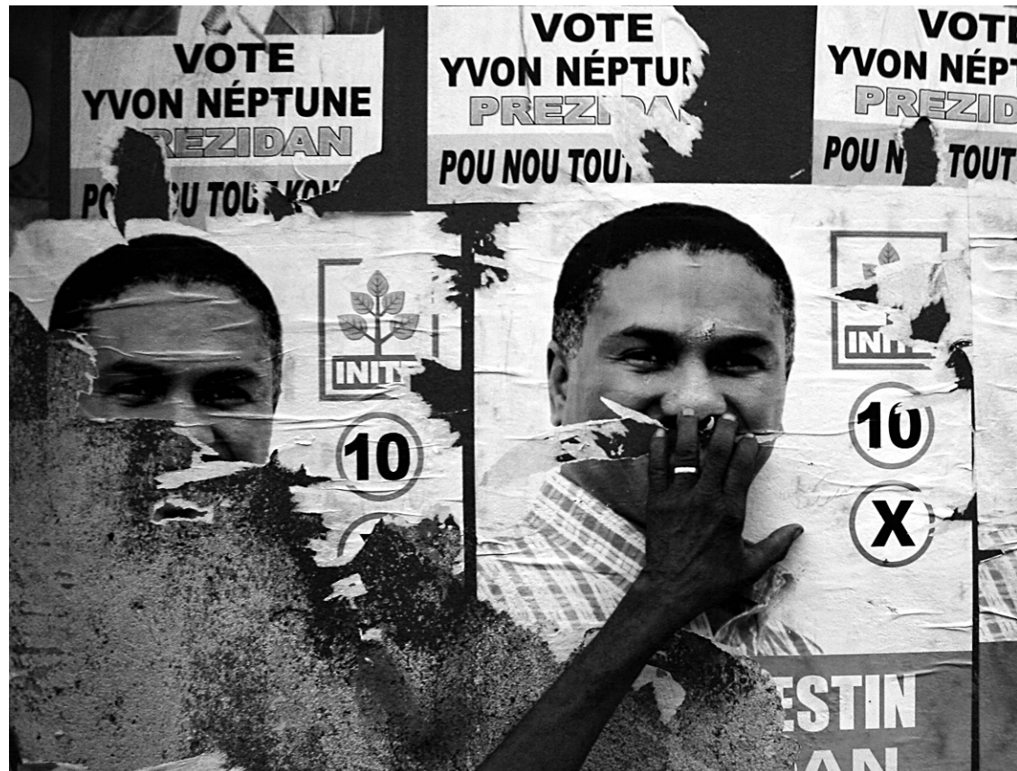
Des affiches du candidat écarté du deuxième tour, Jude Célestin, ornent encore les murs de Port-au-Prince.

Par ailleurs, en 25 ans d'expérience électorale moderne, c'est la première fois qu'un second tour d'élection présidentielle doit avoir lieu dans le pays, une situation qui avait été évitée de justesse en 2006 lorsque Préval avait en face de lui le candidat Leslie Manigat. Une formule de répartition de votes blancs avait alors été utilisée par le CEP pour permettre à Préval de réunir 50 % plus une