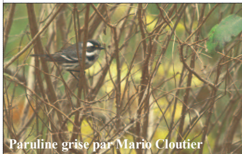
Paruline grise