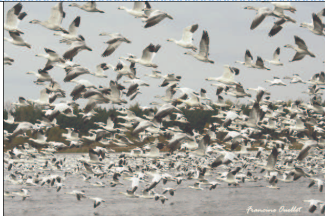
Réservoir Beaudet 14-10-06

Économie de temps et d'argent!!! Votre comité