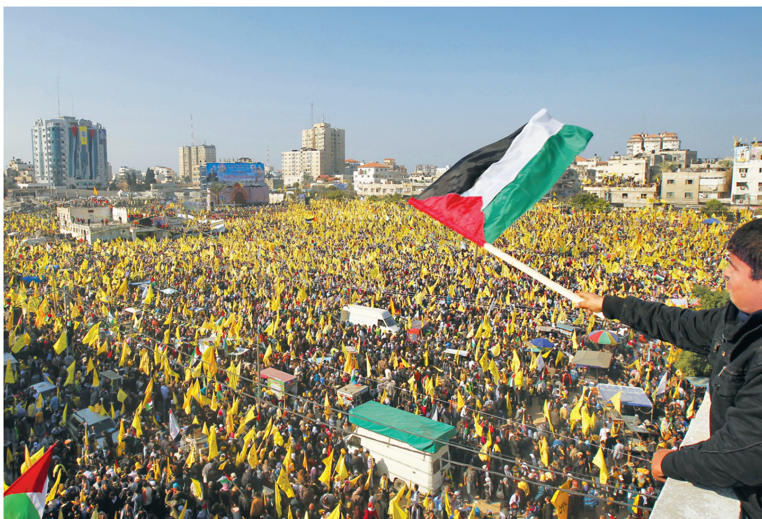
Les participants, dont un grand nombre de femmes et d'enfants, brandissaient les étendards jaunes du mouvement.