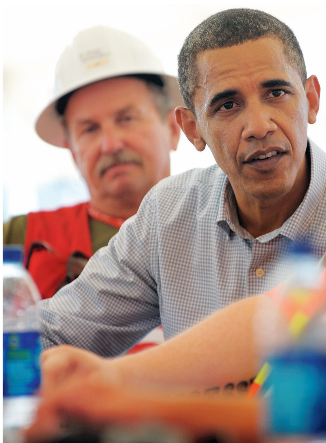
Barack Obama discutant avec des travailleurs lors de la dernière campagne électorale. Parmi les défis qui attendent le président réélu, celui de l'emploi est sans doute celui qui préoccupe le plus ses administrés.