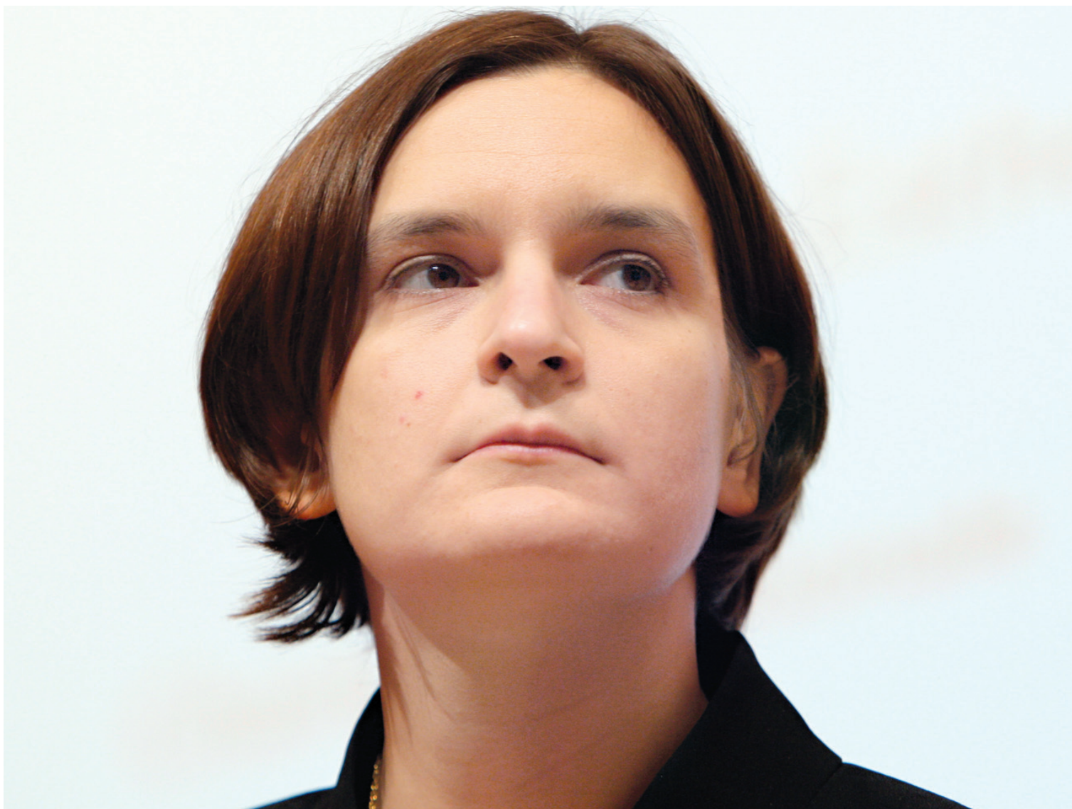
Esther Duflo, «une intellectuelle française de centre gauche qui croit en la redistribution», a déjà écrit le New Yorker .