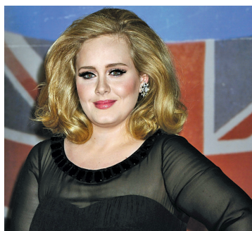
La chanteuse britannique Adele

En tout, 41 chansons ont été téléchargées plus de deux millions de fois, ce qui a permis aux ventes numériques et d'ensemble d'atteindre un nouveau sommet, même si les ventes d'albums ont reculé après avoir progressé momentanément.