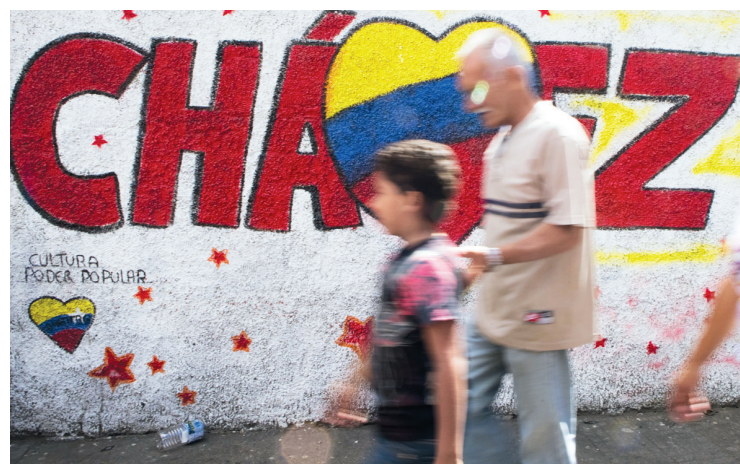
Les graffitis à la gloire du président abondent à Caracas.

Jeudi soir, Diosdado Cabello était apparu auprès du vice-président Nicolas Maduro à