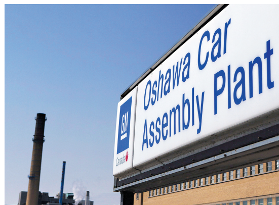
MICHELLE SIU LA PRESSE CANADIENNE

Quant au bilan 2012 du marché du travail au Québec, l'Institut de la statistique du Québec (ISQ) a estimé que l'emploi a crû pour atteindre près de 4 millions. Cette progression de 0,8% par rapport à la moyenne annuelle est légèrement plus faible que celle de 1% observée en 2011. L'ISQ a précisé que les gains de 2012 sont comptabilisés uniquement dans l'emploi à temps plein, qui affiche un gain moyen de 36700, alors que l'emploi à temps partiel a diminué de 5900. Phénomène encore récent, par groupes d'âge, ce sont les personnes de 55 ans