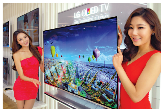
AFP/LG ELECTRONICS L'écran de nouvelle génération du sud-coréen LG, qu'on dit organique électroluminescent.

Leur premier fabricant mondial, le sud-coréen Samsung, entretient les attentes avec un message sur son blogue où il promet «une forme de télévision nouvelle et sans précédent»