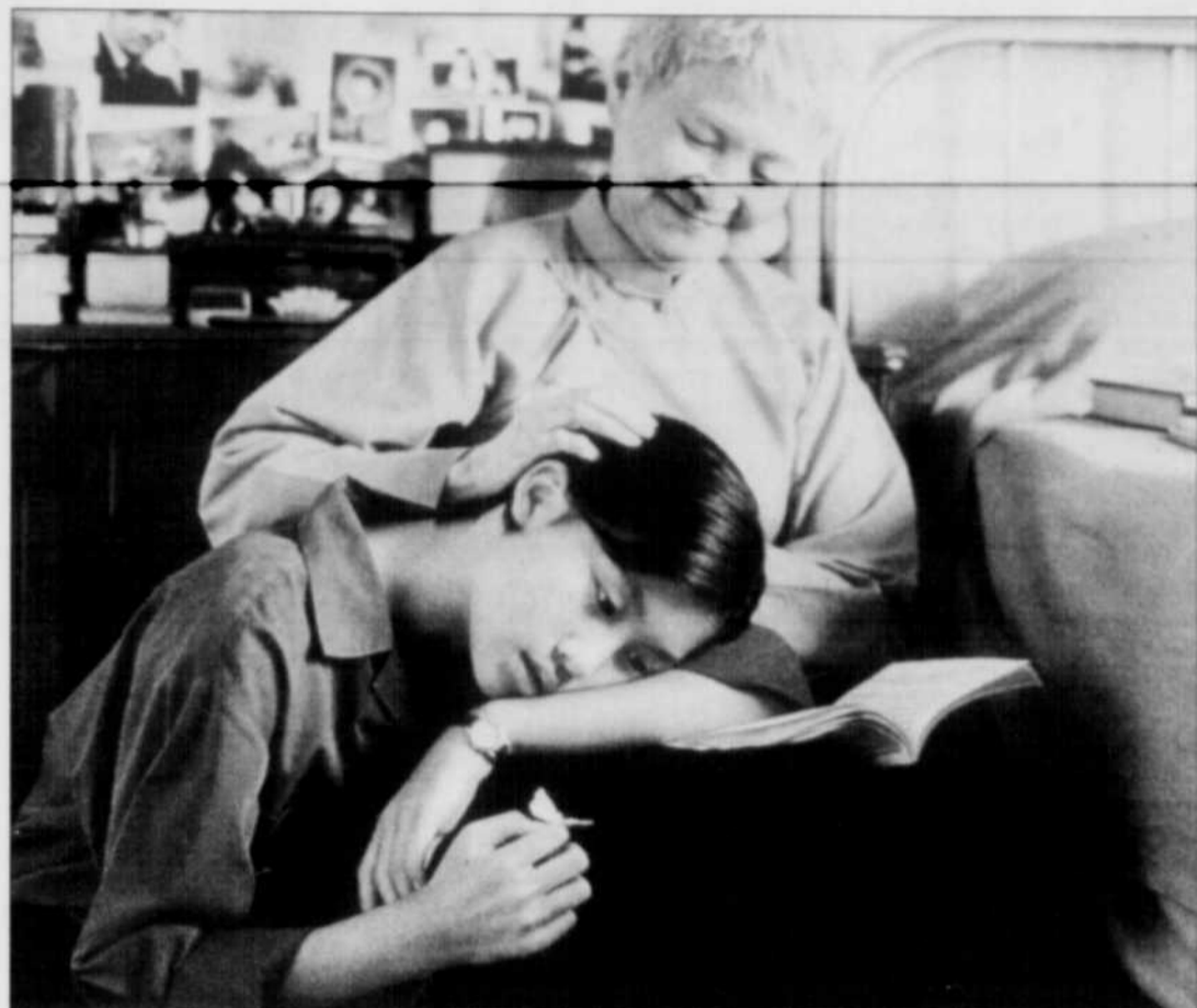
La grande réussite de « Yi Yi » vient de l'immense sensibilité avec laquelle Edward Yang a filmé les choses. Les plans sont longs et lents.