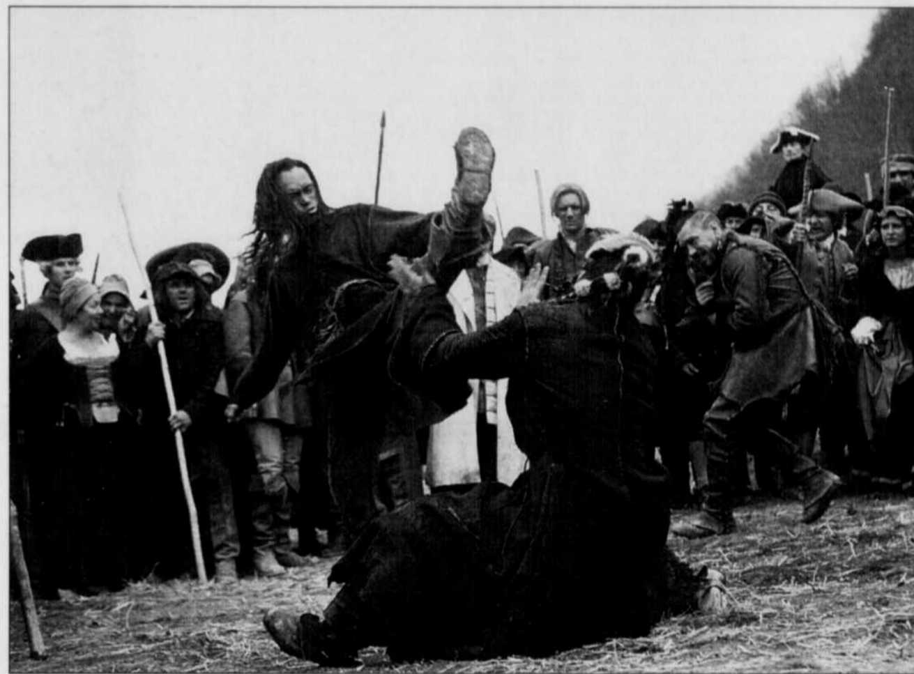
Une mystérieuse bête terrorise la région du Gévaudan dans le drame fantastique «Le pacte des loups». À l'affiche dans les cinémas Lido, Le Clap, Starcité, Cinéplex Charest et Beaufort.

RASSEMBLEMENT DES FAMILLES DÉRY ET PAQUET. à l'ancien Ephraïm-Bédard, Charlesbourg, le samedi 30 juin de 13h30 à 16h30. Info: Société historique de Charlesbourg 624-7745, 626-3647, 875-3972.