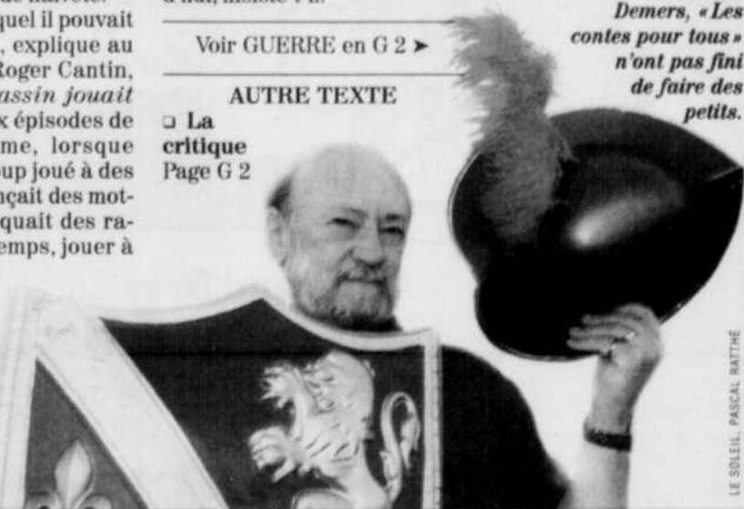
LE SOLEIL - PASCAL BATHIE