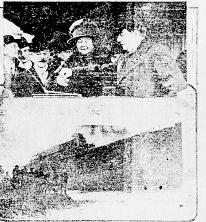
En haut: Mme Baldwin, épouse du premier ministre du Canada-Bretagne, que l'on aperçoit à droite, prenant le bonjour aux passagers du paquebot avant de ses amarrages. En bas: le "Duchess of Bedford" immédiatement après son lancement.

Mme Stanley Baldwin, épouse du premier ministre du Canada-Bretagne, que l'on aperçoit à droite, prenant le bonjour aux passagers du paquebot avant de ses amarrages. En bas: le "Duchess of Bedford" immédiatement après son lancement.