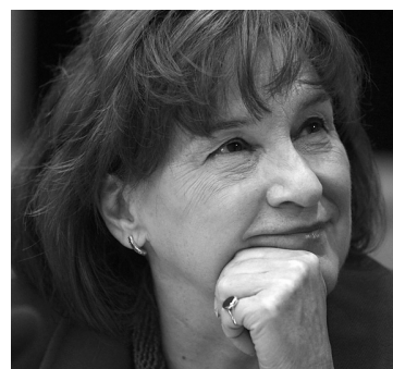
ADRIAN WYLD PC