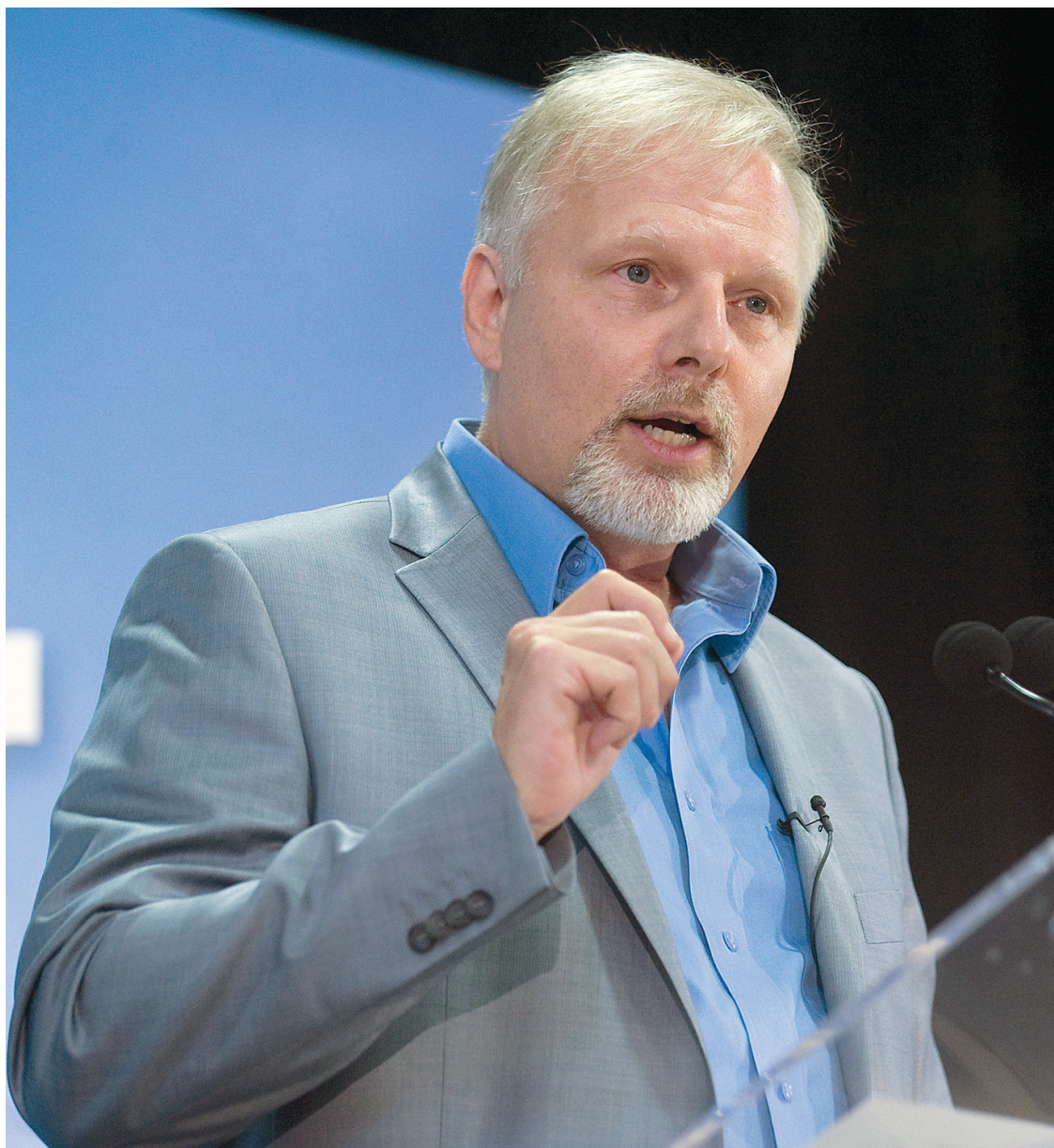
GRAHAM HUGUES LA PRESSE CANADIENNE

Mais, au-delà de tous ces défis, la Francophonie souffre d'un handicap qu'elle devra bien surmonter un jour. C'est l'engagement de la France elle-même qui a trop souvent fait défaut. Au-delà des beaux discours, et Dieu sait que le dernier président n'en a pas manqué, le français y est trop souvent considéré comme une langue ringarde alors que le globish snobinard des élites parisiennes serait doué de toutes les vertus de la modernité. Tant qu'on ne combattra pas pied à pied ce préjugé, d'ailleurs aussi présent au Québec, tant que la France se contentera d'une défense du bout des lèvres, la Francophonie demeurera un vœu pieux. Le nouveau gouvernement français a là une belle occasion de se manifester et de rompre avec cette époque où le président faisait de beaux discours pendant que sa ministre de l'Économie parlait anglais avec ses employés.