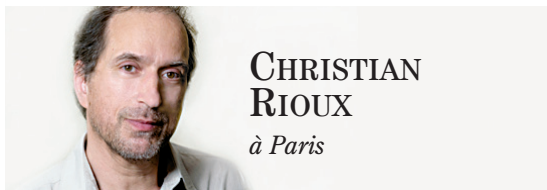
CHRISTIAN RIOUX à Paris

Dans une semaine, une partie de l'actualité politique canadienne se transportera à plusieurs milliers de kilomètres, dans la capitale de la République démocratique du Congo où se tiendra le XIV e Sommet de la Francophonie. L'occasion ne devrait pas passer inaperçue puisque c'est à Kinshasa que la nouvelle première ministre Pauline Marois fera ses premiers pas sur la scène internationale.