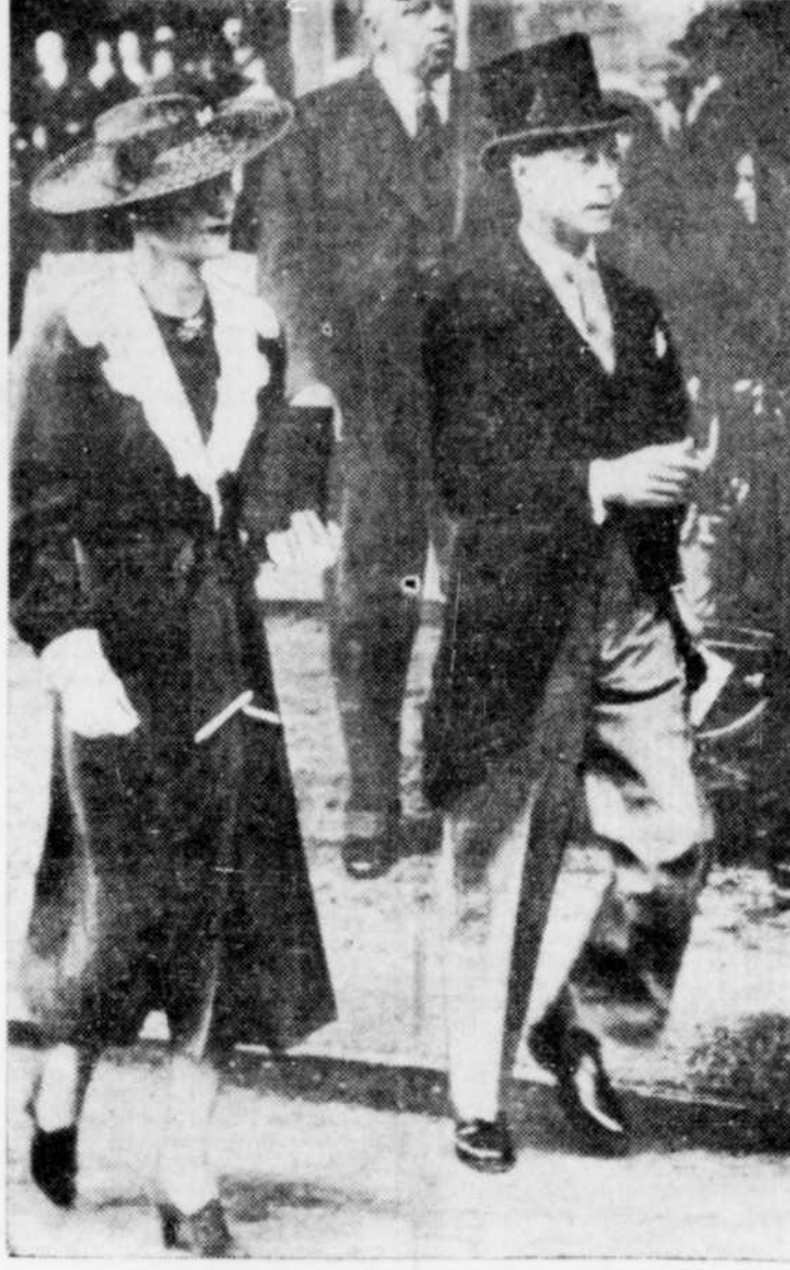
Cette nouvelle photo du Duc et de la Duchesse de WINDSOR fut prise comme ils quittaient une église de Paris, à la suite du service anniversaire du Jour du Souvenir, avant leur départ pour la Riviera, avant la visite du roi George et de la reine Elizabeth à Paris, ce mois-ci.