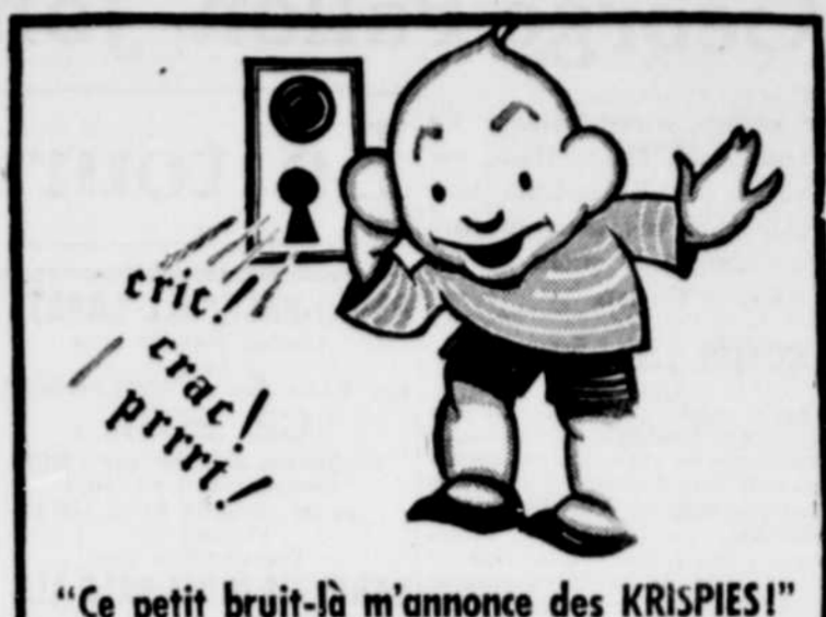
"Ce petit bruit-là m'annonce des KRISPIES!"

Après l'assemblée, une partie de cartes entre les membres eut lieu et l'assemblée fut ajournée jusqu'en septembre.