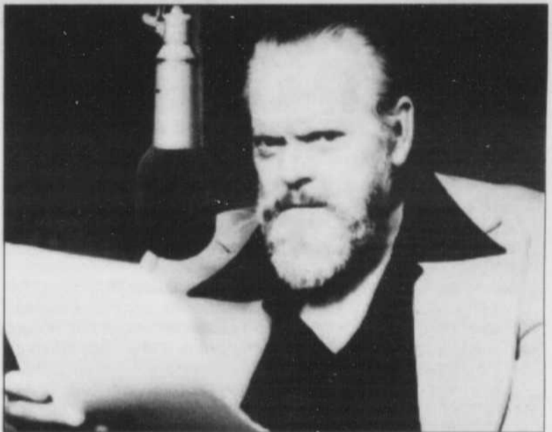
ORSON WELLES - Du 16 au 18 novembre, Orson Welles (photo), l'homme et ses oeuvres, seront en vedette à la Boîte à bleuets et au Ciné-club d'Alma.