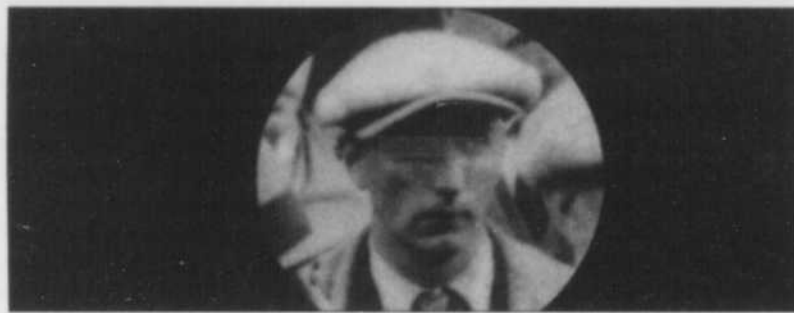
CURRERI - L'artiste Chris Curreri prend plaisir à établir des liens entre les photographies anciennes et le traitement numérique. Dans «Bicycle Race» il s'intéresse aux visages des individus en les modifiant de manière à troubler l'ambiance et créer un autre univers.

caisses Desjardins, 50 rue des Roses à Métabetchouan-Lac-à-la-Croix. La corporation parlera de ses démarches menant à la réalisation de la phase 2 des rénovations de ses installations.