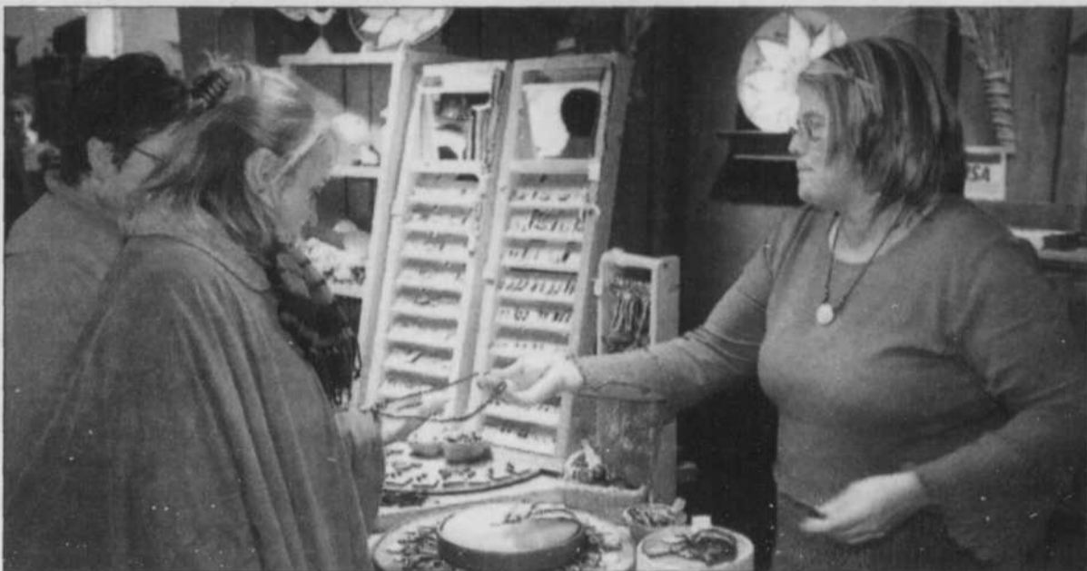
ARTISANS - Les visiteurs du 25e Salon des métiers d'art du Saguenay-Lac-Saint-Jean, qui se déroule jusqu'au 16 novembre, à l'hôtel Le Montagnais de Chicoutimi, pourront apprécier le talent de nos artisans.

Il y a bien plus encore dans ce salon, vêtements de cuir, bijoux d'aluminium, d'argent et d'or, céra-