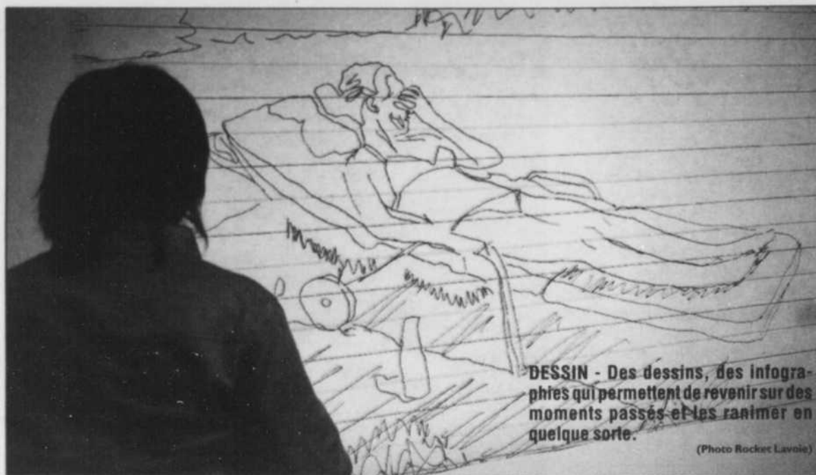
DESSIN - Des dessins, des infographies qui permettent de revenir sur des moments passés et les ramener en quelque sorte.