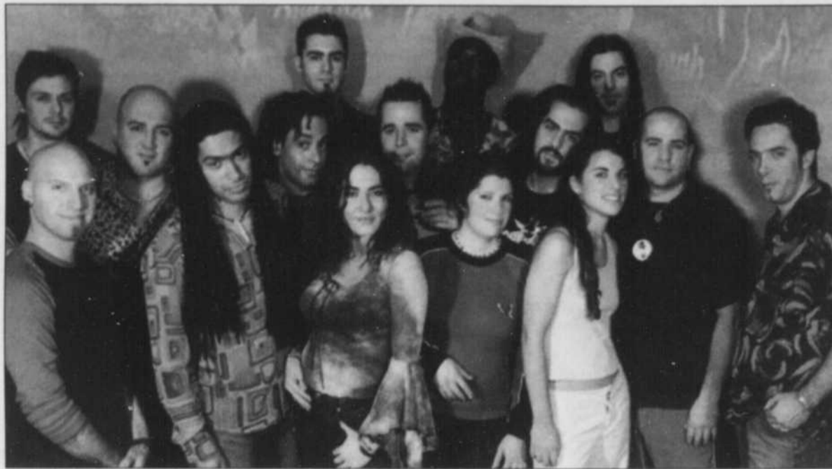
COLLECTIVO - Le groupe constitué d'une quinzaine de membres de la scène de musique alternative de Montréal fera la fête au Côté-Cour de Jonquière le 18 novembre à 20h30. Musique latine, mélanges multiculturels. Une musique bigarrée.