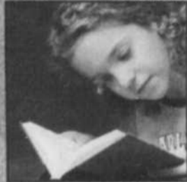
L'Heure du conte