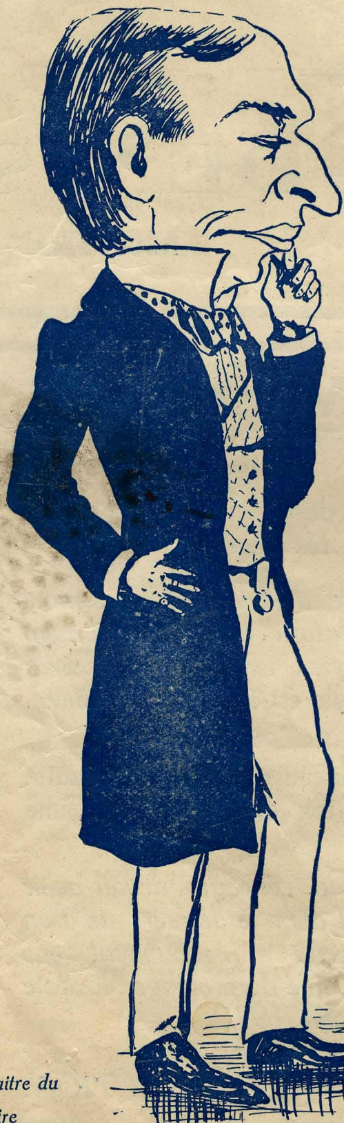
Un Maître du Rire