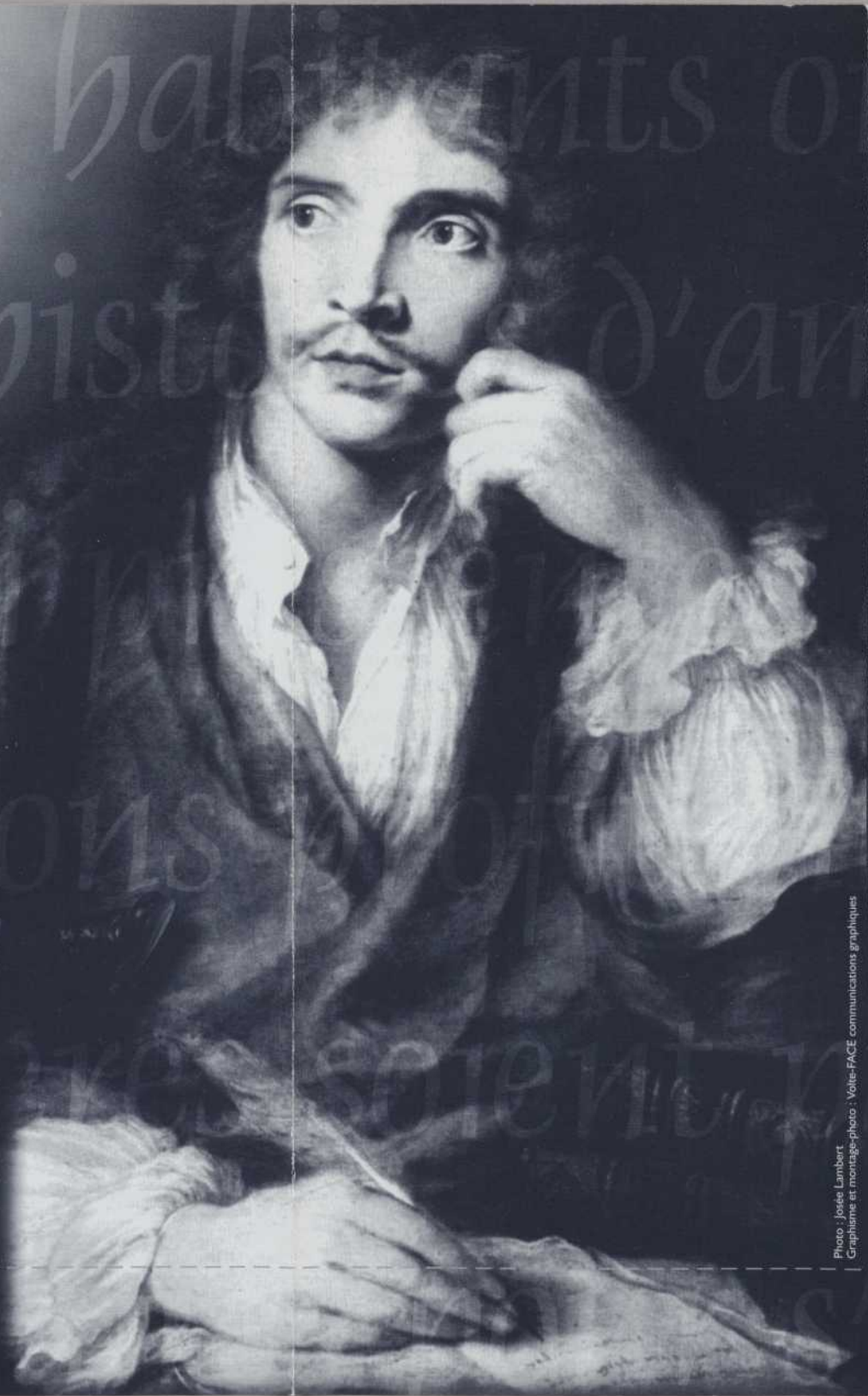
Photo : Josée Lambert Graphisme et montage-photo : Volte-FACE communications graphiques