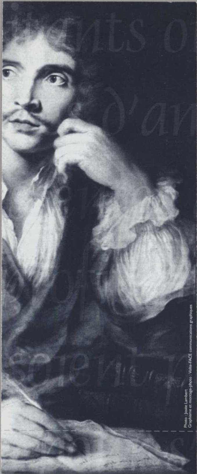
Photo : Josée Lambert Graphisme et montage-photo : Volte-FACE communications graphiques