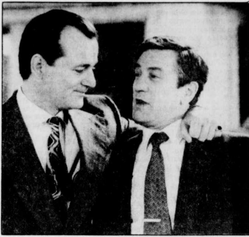
Robert de Niro (à droite en compagnie de Bill Murray) présentera, hors-compétition, son film « Mad Dog and Glory ».

Le Festival de Cannes est l'événement le plus médiatisé au monde, après les Olympiques. Si le champagne coule à flot, c'est aussi qu'on y brasse de grosses affaires. Et de petites, quoique importantes affaires ; comme c'est le cas pour le Québécois Louis Dus-sault, des Films du Crépuscule : un cinéophile qui recherche, dans l'ombre des gros, le film « beau,