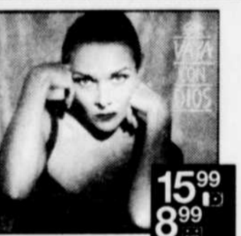
VAYA CON DIOS Time flies 15.99 8.99