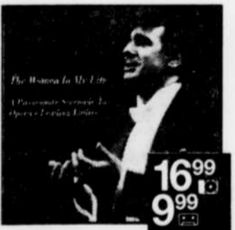
PLACIDO DOMINGO The women in my life 16.99 9.99