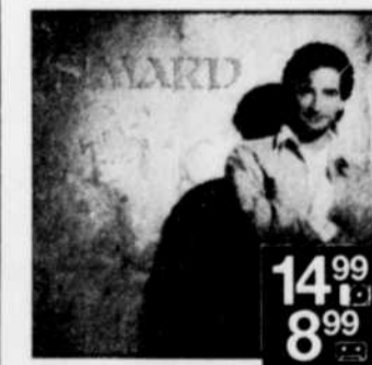
René Simard E=MC² 14.99 8.99

JESSYE NORMAN sera présente ARCHAMBAULT MUSIQUE, chez Ste-Catherine Est, le samedi 15 mai de 14h à 16h, où, pour la première fois à MONTREAL, elle autographiera ses disques.