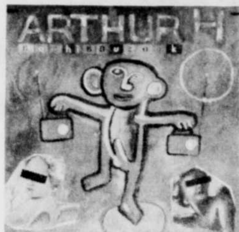
Avec son deuxième disque, le pianiste français pousse sa folie un peu plus loin.

D'abord, il y a cette horrible photo de la pochette, où l'héroïne des derniers films de Gilles Carle pose, offerte et provocante. D'un mauvais goût incontestable. À l'intérieur, l'image est reproduite dans son intégralité, un peu comme la page centrale de certains