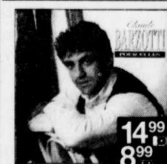
CLAUDE BARZOTTI Pour elles 14.99 8.99