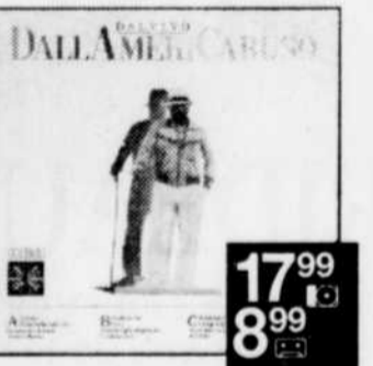
LUCIO DALLA Dall'america caruso 17.99 8.99