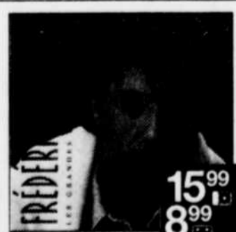
FRÉDÉRIC FRANÇOIS Les grandes chansons 15.99 8.99