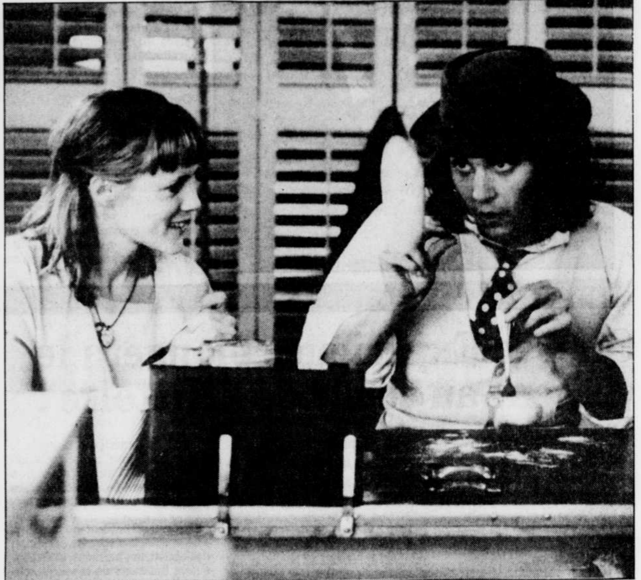
Mary Stuart Masterson et Johnny Depp dans une scène de Benny & Joon.