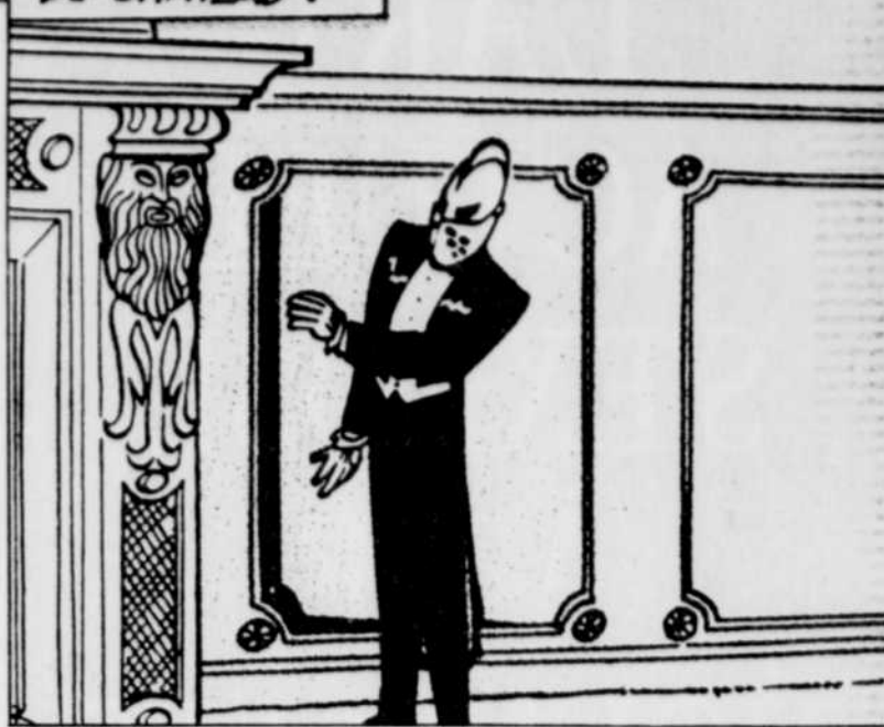
Monsieur Choc, gentleman cambrioleur, ménage ses effets et rarefie ses théâtrales apparitions !

PENDANT CE TEMPS, À L'INTÉRIEUR DU CHÂTEAU.