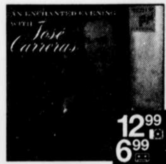
JOSÉ CARRERAS An enchanted evening with... 12.99 6.99