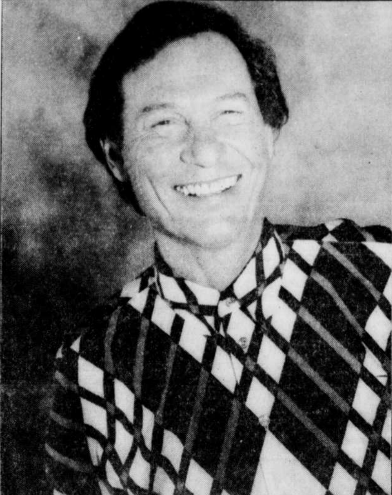
Jean-Pierre Ferland est de retour au Capitole avec son spectacle «Bleu, Blanc...Blues», ce soir et demain, pour souligner la fête des Mères.

mans d'horreur sous un pseudonyme est victime d'un doublement de la personnalité qui lui fait commettre des actes horribles. (Cinéplex charest et Lido)