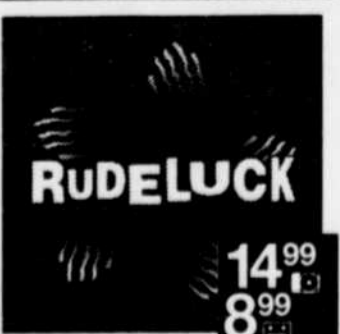
RUDELUCK 14.99 8.99