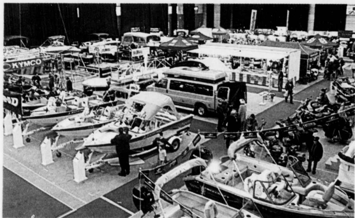
Pour sa 28 e édition, le Salon Expo Nature reçoit plus de 125 exposants de partout au Québec.

Yves Houles de la compagnie Adrénaline fera quant à lui une conférence sur la chasse, en plus de présenter les produits de son entreprise, tout en répondant aux questions du public.