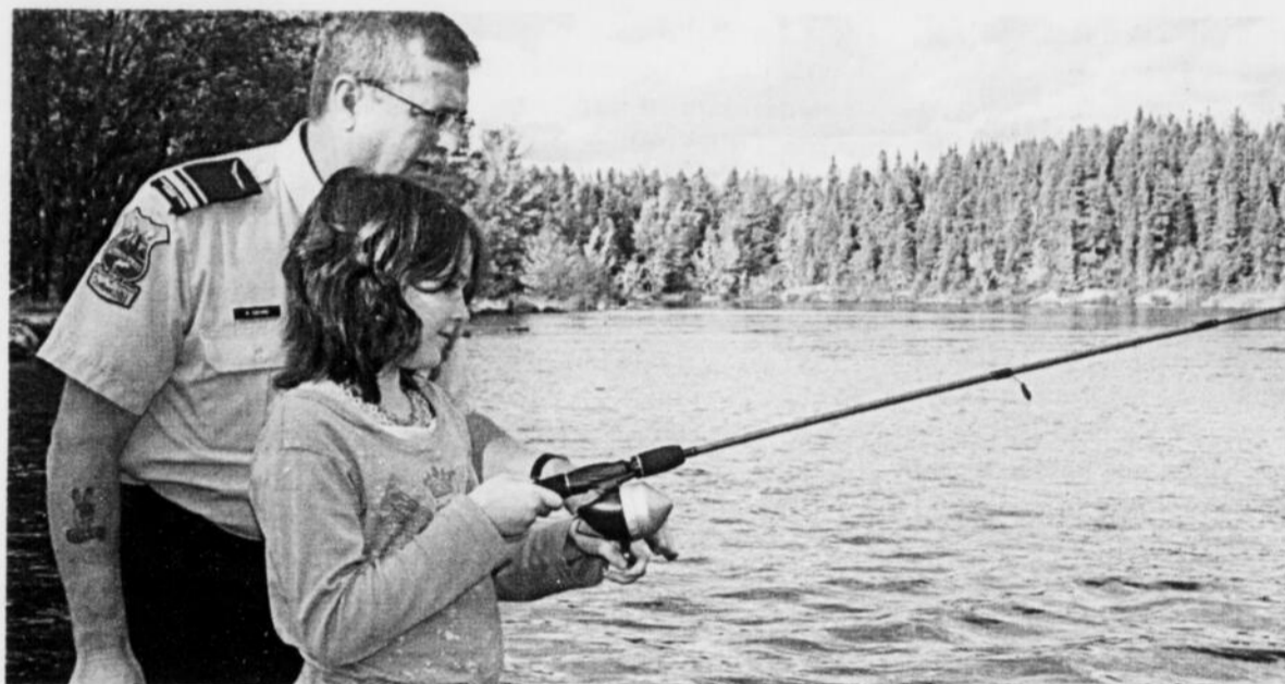
Le Salon de la Relève veut conscientiser les jeunes sur l'importance des ressources naturelles pour notre région.

Le responsable des communications du MRNF, Réjean Goudreault, explique que ce projet est né du besoin de susciter l'intérêt des jeunes et de la relève sur les ressources naturelles et les possibilités d'avenir qui s'offrent à eux. «Il faut démontrer à la population l'importance de la forêt