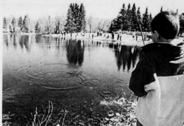
Le tournoi de pêche qui se déroulera du 15 au 17 mai prochain, est chaque année de plus en plus populaire!

Avec plus de 1000 membres, l'ACPC est une des plus grosses associations dans le domaine de la chasse et de la pêche au Québec. Un tel regroupement permet entre autres de faire valoir ses idées auprès du ministère et de défendre les droits des chasseurs et des pêcheurs.