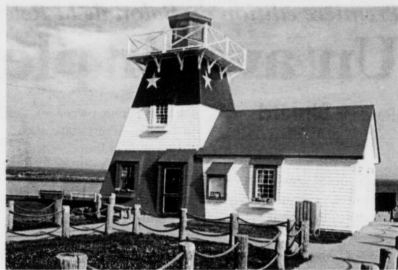
Le phare de Grande-Anse, Nouveau-Brunswick

Pour représenter la magnifique Aquarium et Centre marin du Nouveau-Brunswick, qui est reconnu principalement pour ses nombreux phoques, un petit aquarium sera sur place avec à l'intérieur quelques homards bleus. Ve-