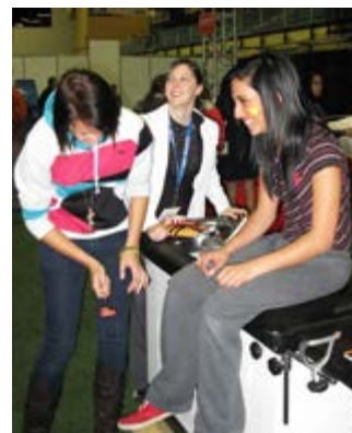
Deux élèves apprennent à tester leurs réflexes avec une étudiante en médecine.