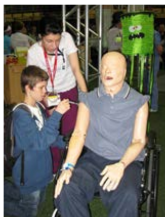
Un visiteur apprend à administrer un vaccin avec une infirmière auxiliaire.