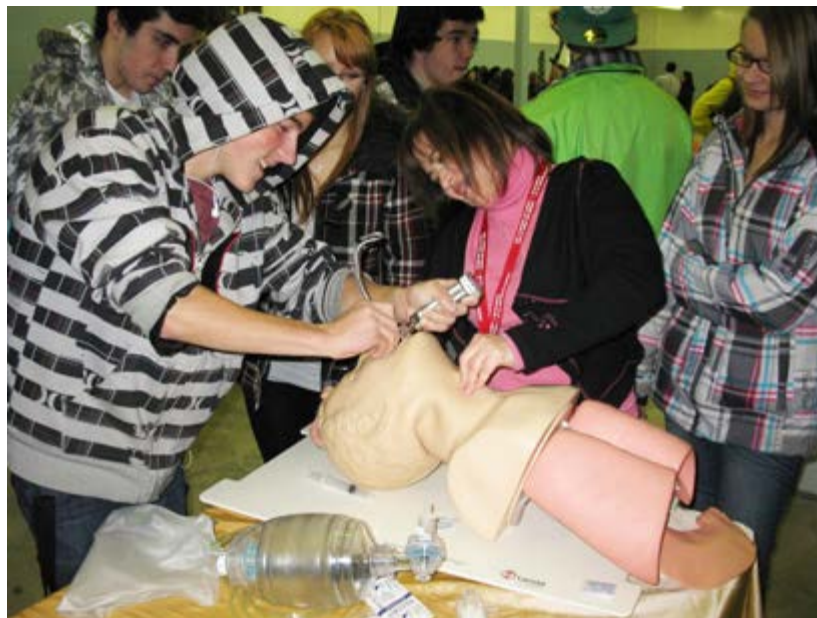
Un visiteur expérimente une technique spécialisée avec l'inhalothérapeute.