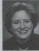
Manon Blanchet Députée de Crémazie