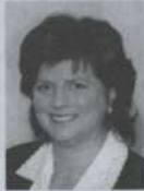
Nicole Léger Députée de Pointe-aux- Trembles