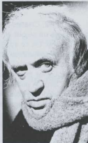
Alistair Sim dans le rôle de Scrooge, 1951

Pour reconquérir les nombreux lecteurs qui avaient été déçus par son roman Martin Chuzzlewit , Dickens publiait en 1843, Un chant de Noël ( A Christmas Carol ), dont est adapté le spectacle Scrooge . Ce conte constitue le premier d'une tradition qu'il allait poursuivre jusqu'à sa mort: la parution, chaque année pour célébrer Noël, d'un livre ou d'une nouvelle spéciale, dans la revue dont il est devenu rédacteur en chef en 1859. Après le succès de Un chant de Noël sont parus Le carillon , Le grillon du foyer , puis La bataille de la vie et enfin, L'homme hanté et le marché du fantôme . Si la période de Noël était aux yeux de Dickens la fête la plus importante de l'année, elle représentait aussi le point culminant de la relation privilégiée entre l'auteur et son public. Chaque année, son conte de Noël était en effet attendu avec impatience par des dizaines de milliers de lecteurs!