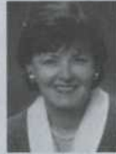
Rita Dionne-Marsolais Députée de Rosemont