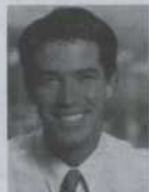
André Boisclair Député de Gouin

Bonne chance, bon succès et Joyeux temps des fêtes !