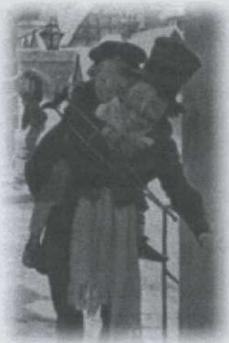
Bob Cratchit et Tiny Tim, par Jessie Wilcox Smith, 1925.

Toute la nuit se succèdent les spectres du Passé, du Présent et du Futur, qui entraînent Scrooge dans un voyage fantastique à travers son enfance et sa jeunesse, puis auprès des gens qu'il côtoie régulièrement sans vraiment leur prêter attention, et finalement dans une vision cauchemardesque de la fin de sa propre vie, où il meurt abandonné et dépouillé, à la joie de tout le monde.