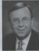
André Boulerice Député de Sainte-Marie- Saint-Jacques