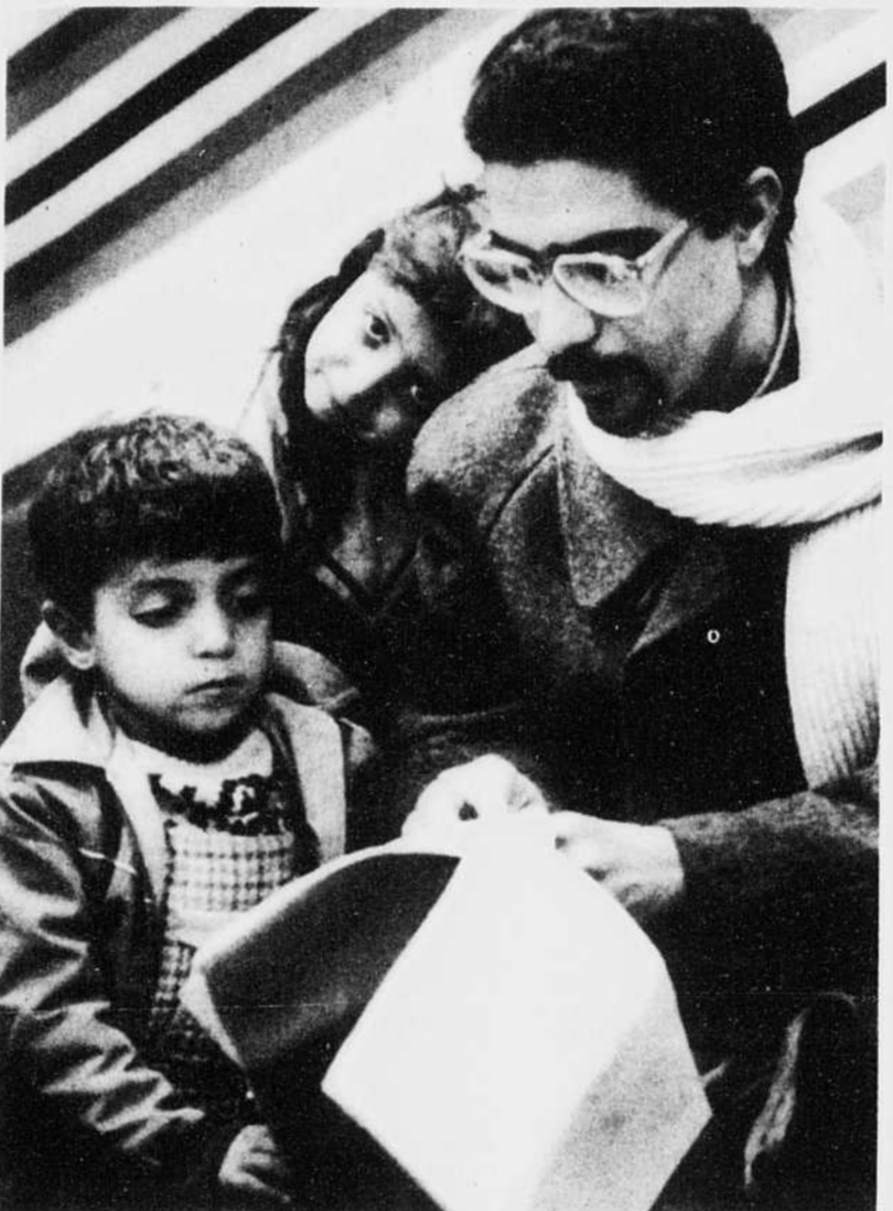
Accompagné de ses enfants, un revendicateur du statut de réfugié patiente pendant qu'un arbitre se penche sur sa demande, à l'aéroport de Mirabel.

Quant aux familles, près de 1,3 million de familles comptant deux personnes ou plus, soit 18,8 pour cent du total, vivaient dans la pauvreté d'après les calculs du sénateur. Pour Statistique Canada, la proportion était de 11,3 pour cent, ou 777,000 familles.