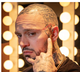
6 mars - 30 $ SOULDIA