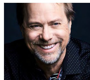
27 mars - 38 $ LE DERNIER SACREMENT