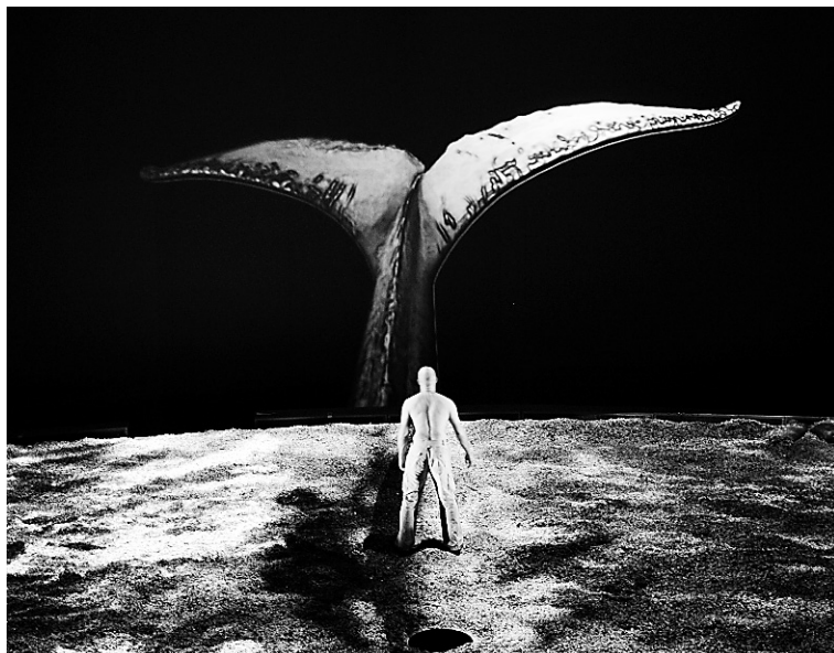
L'expertise d'Hybride en stéréoscopie dans les films 3D lui servira pour développer un outil qui permettra de simuler avec exactitude l'effet de relief désiré sans avoir besoin de bâtir une scène comme a dû le faire l'équipe de Paradis perdu .

L'expertise d'Hybride en stéréoscopie dans les films 3D