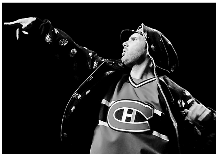
Jon Lajoie ne manque pas d'originalité. Mais son spectacle aurait pu être mieux figolé, avec plus de vidéos et de sketches originaux.