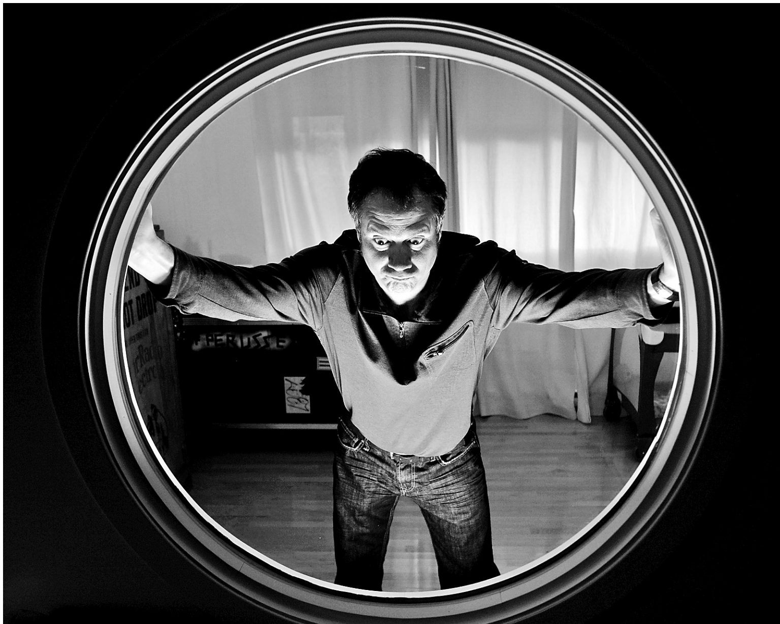
En 1990, François Pérusse a fait une parodie de la chanson du dessin animé, Les Simpson passent au Bart , qui lui a permis d'atteindre la notoriété à CKOI, puis de lancer la série des Deux minutes du peuple .