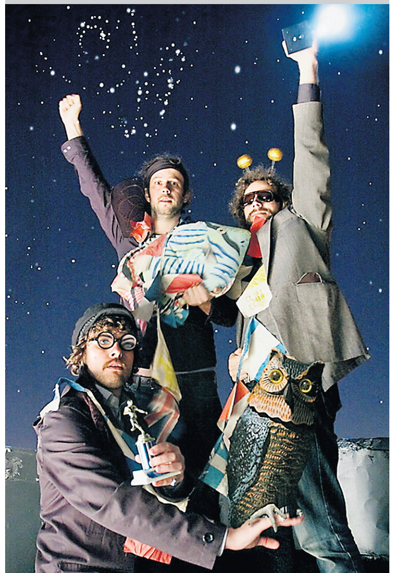
Plants and Animals