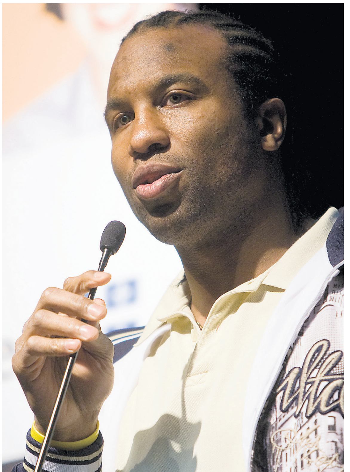
Le joueur de hockey Georges Laraque, narrateur du film Terriens , s'est engagé à présenter le film une fois par mois dans une salle louée à ses frais.

Le problème avec un film furieusement militant comme Earthlings , c'est qu'il est tellement démagogue, réducteur et culpabilisant, qu'il perd toute crédibilité et finit par tuer les quelques idées intéressantes qu'il avance. Et