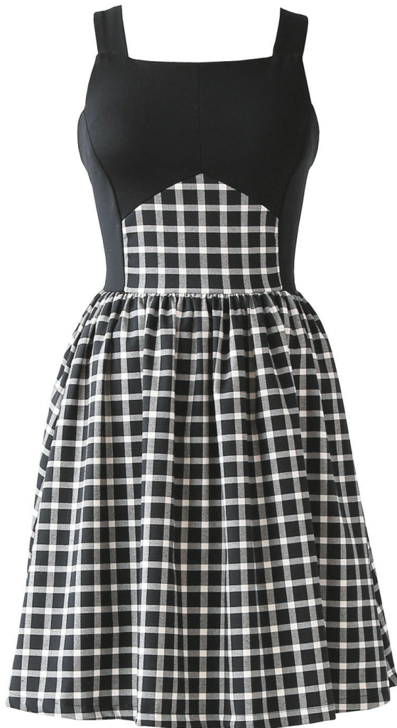
Une robe de Marigold

En privilégiant l'entraide, le partage, la solidarité et la synergie, ce vivier de nouveaux talents s'inscrit parfaitement dans la mouvance du slow fashion , qui regroupe de plus en plus