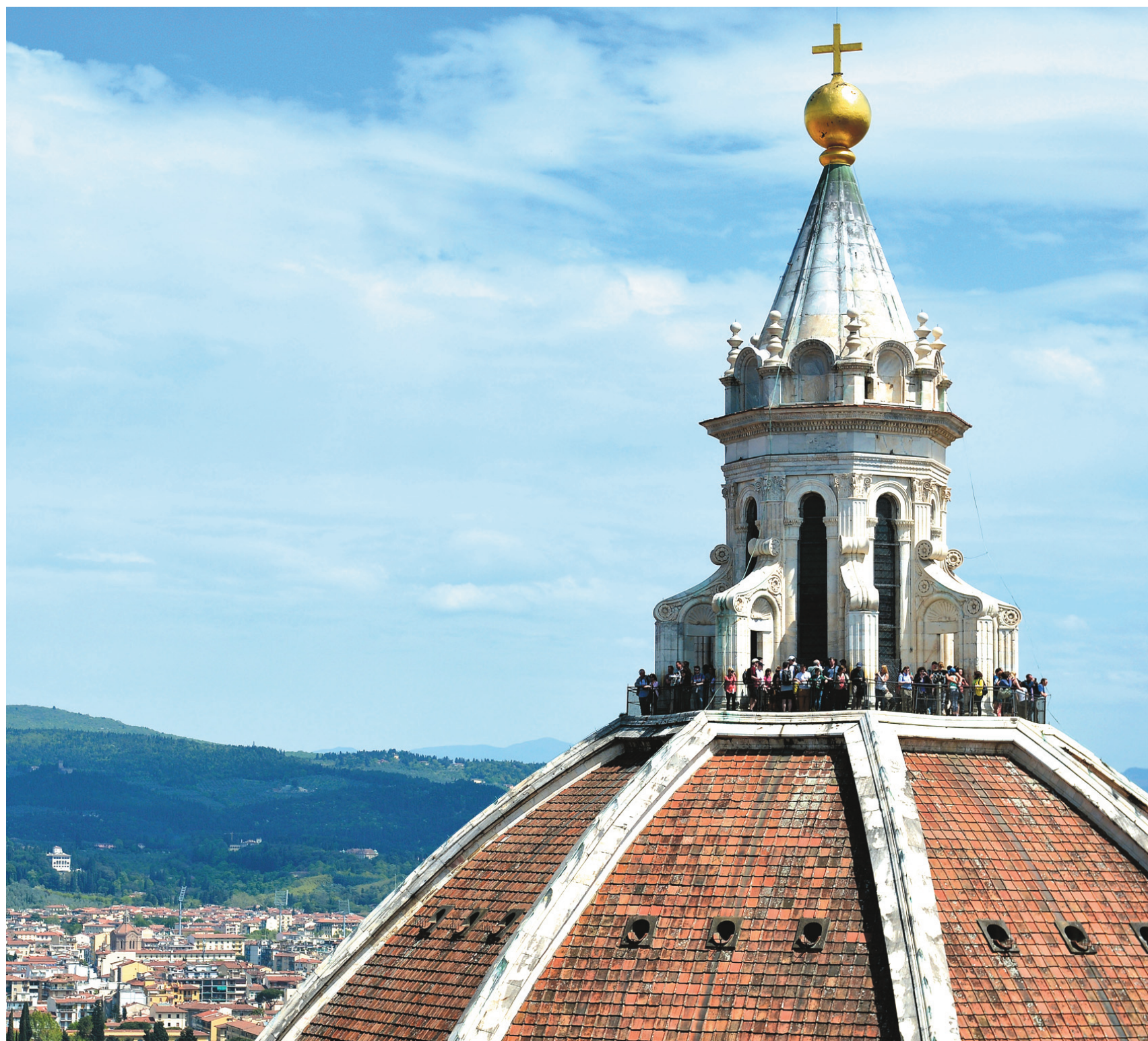
Le dôme de la cathédrale Santa Maria del Fiore à Florence, en Italie.

Si vous choisissez les trains, il faudra vous imposer des horaires stricts. Même chose pour les autocars, et ces derniers parcourent la Toscane un peu partout.