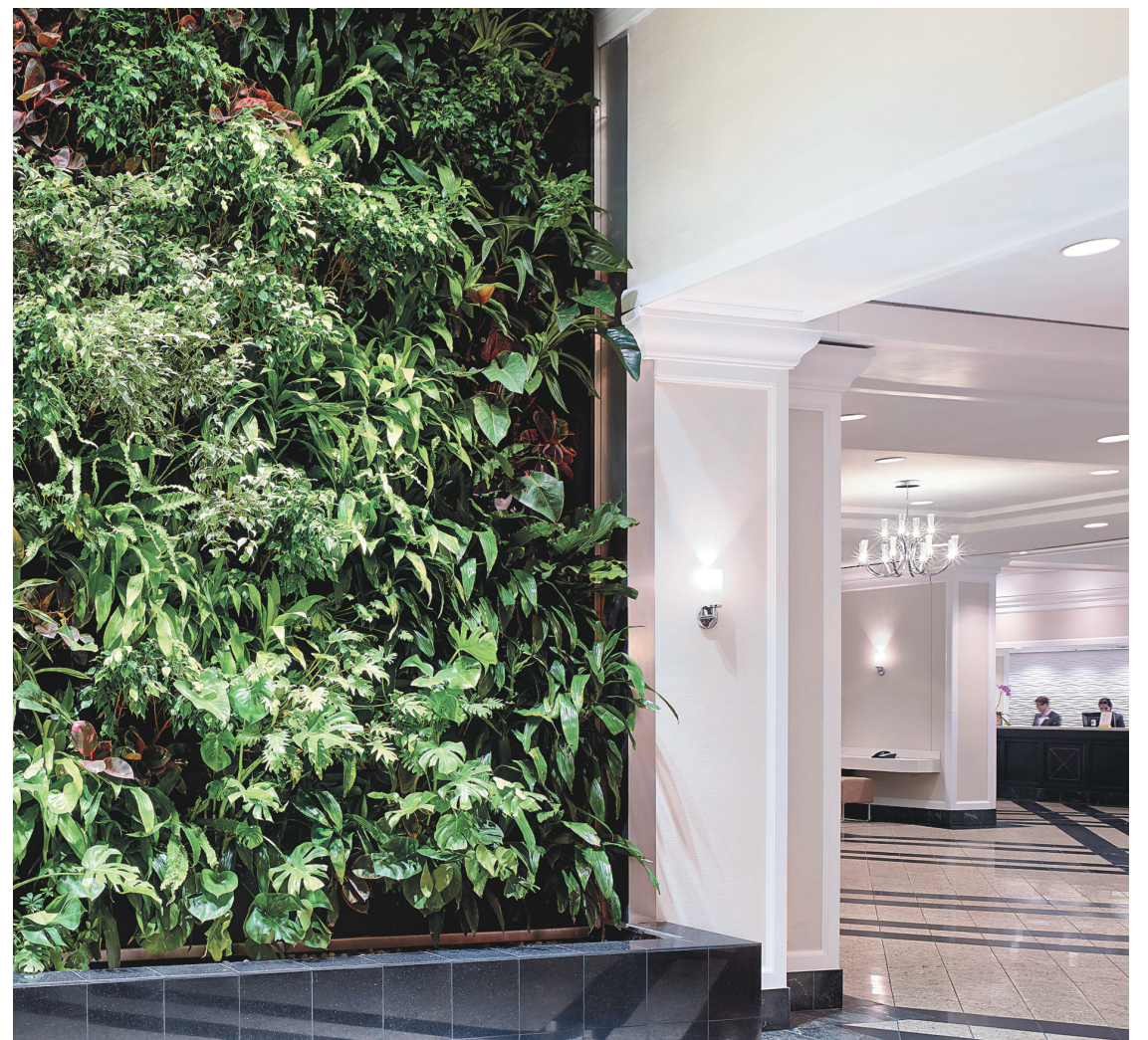
HÔTEL CHELSEA Le Chelsea détient une certification Bronze d'EarthCheck, l'organisme international le plus réputé pour la reconnaissance des bonnes pratiques environnementales.

Le Chelsea se trouve en marge du secteur des grands