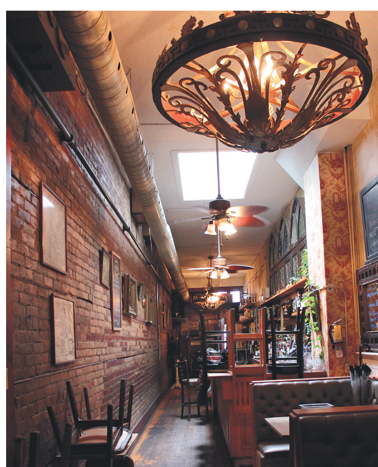
Le bar-spectacle Hole in the Wall, le secret bien gardé des résidents du secteur The Junction.

Mary Macleod's Shortbread , c'est le paradis du sablé maison depuis 1981. La réputation des