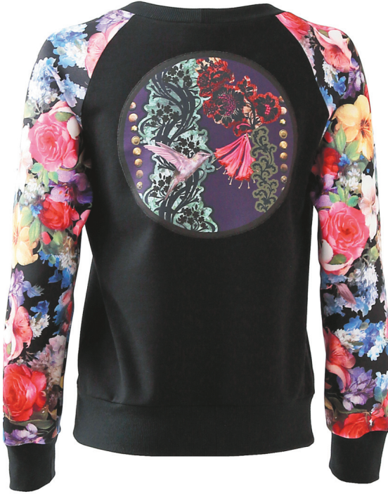
Un chandail de Métamorphose