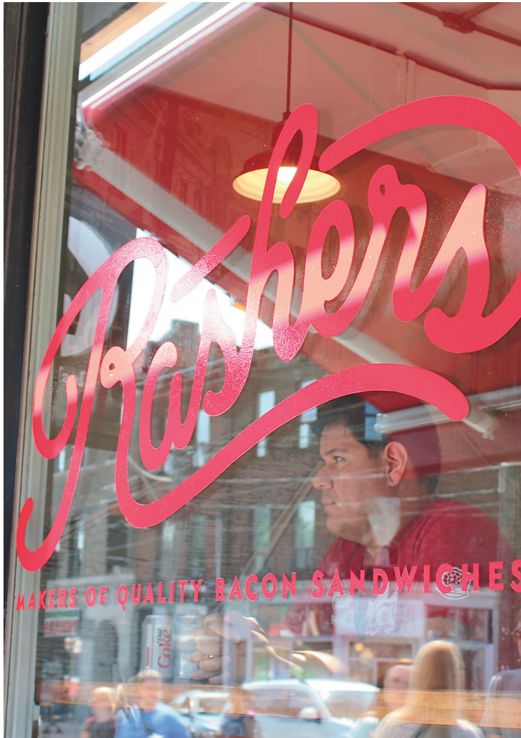
Rashers est une sandwicherie entièrement consacrée au bacon dans Riverside-Leslieville.

C'est en ouvrant les portes des commerces et en discutant avec les propriétaires qu'on voit qu'ils sont tous animés de la même passion : faire du quartier The Junction une communauté, un petit village où il fait bon vivre.