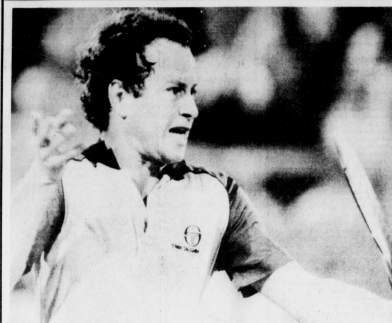
John McEnroe a disposé de Leconte en deux sets.