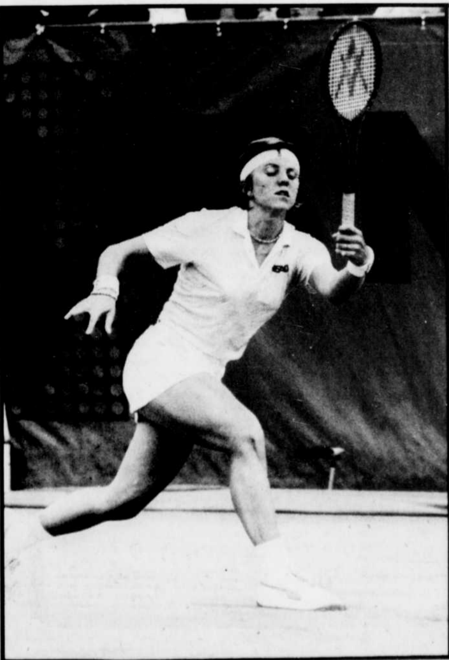
Sylvia Hanika fait désormais partie des cinq meilleures tenniswomen du monde.