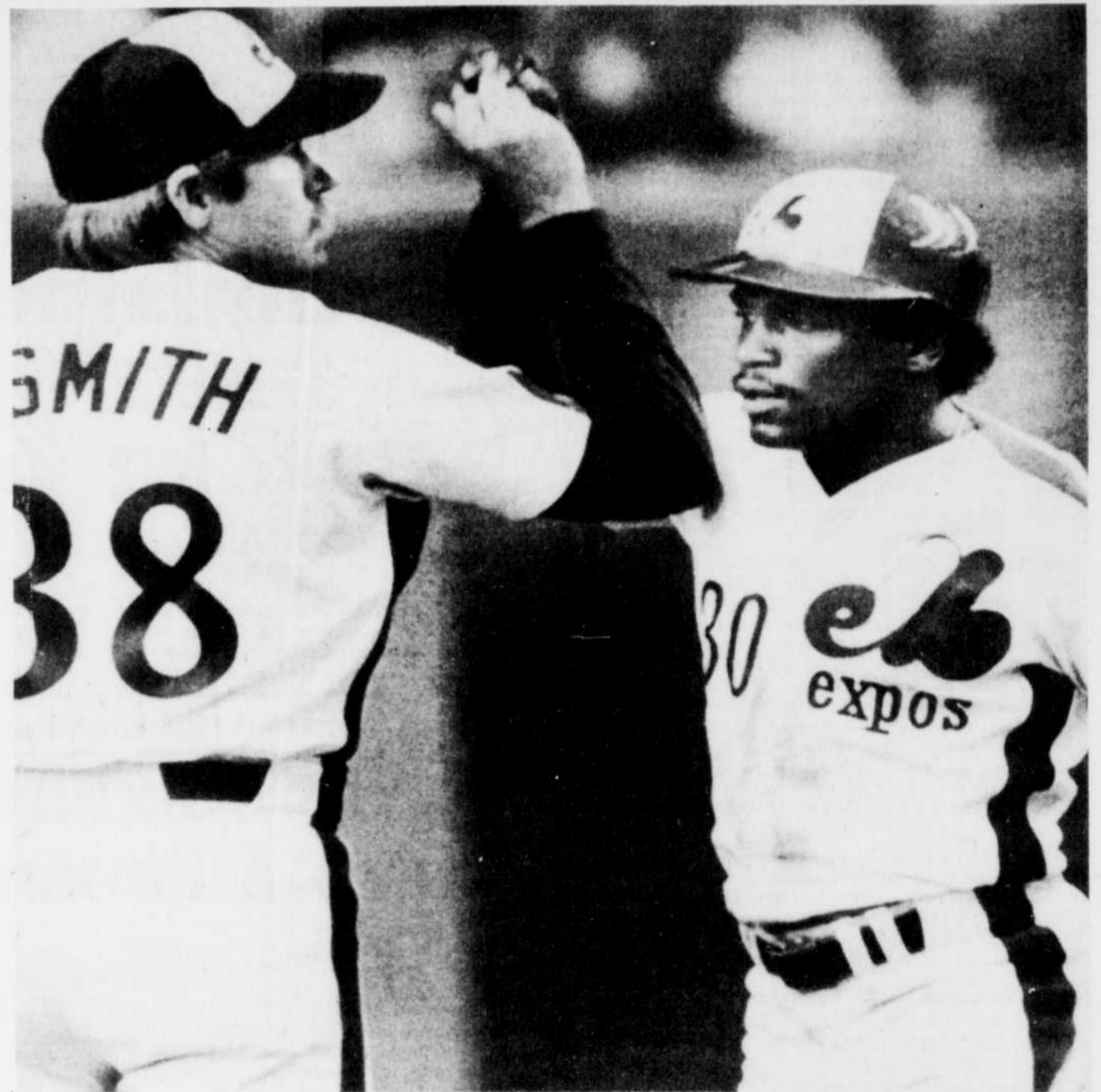
Tim Raines a marqué le point de la victoire en troisième manche à la suite d'un simple d'Al Oliver.

Après un retrait en huitième, Pete Rose a réussi un simple et Manny Trillo un double. Gary Matthews a finalement poussé Rose au marbre à l'aide d'un ballon sacrifice pour porter le compte 3-2.