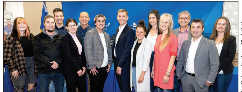
Le maire de Québec, M. Bruno Marchand, entouré de quelques-uns des représentants des organismes communautaires soutenus par le Bal du maire de Québec de la Fondation Jeunes en Tête.

«Après les dernières années, tout le monde s'entend pour dire que l'enjeu de la santé mentale est plus important que jamais, surtout chez nos jeunes, a déclaré le maire de Québec, M. Bruno Marchand. Je suis très heureux que la tenue de notre Bal puisse, une fois de plus, aider des milliers d'adolescents à passer au travers des moments difficiles. La déstigmatisation des enjeux liés à la santé mentale est primordiale et, comme société, on se doit d'y contribuer. Ensemble, donnons les moyens à la Fondation Jeunes en Tête de poursuivre son travail de terrain crucial