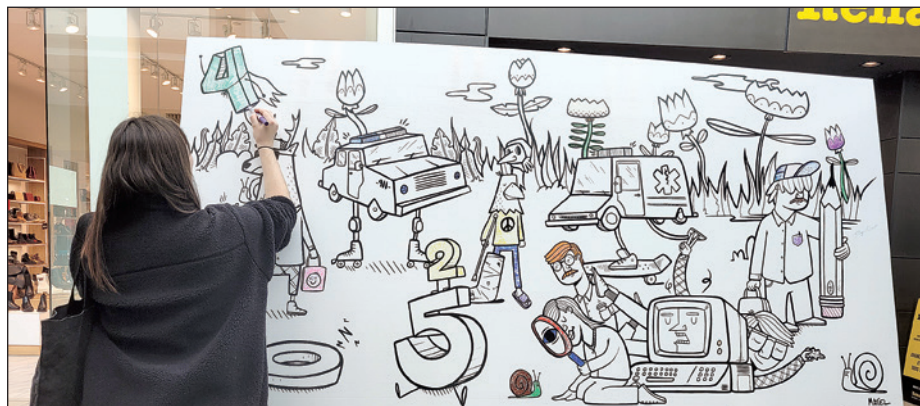
Tous engagés pour la jeunesse, axe de communication de Desjardins face à la jeunesse depuis quelques années.