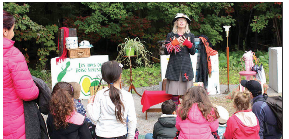
C'est dans le cadre des Journées de la culture qu'une cinquantaine de participants, dont une trentaine d'enfants, ont parcouru les sentiers du Boisé Neilson en quête de l'énigmatique Marie-Sylvestre.