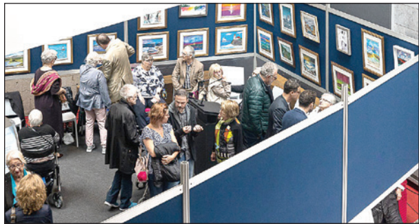
Le public visiteur admire les 50 toiles exposées.