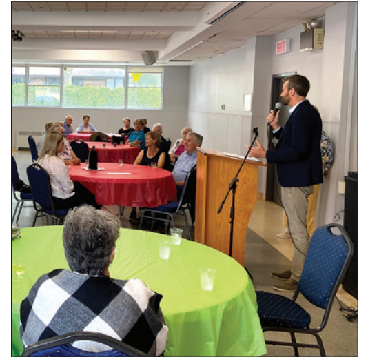
Joël Lightbound, député fédéral de Louis-Hébert, lors d'une visite à la FADOQ Saint-Louis-de-France.

Les fonds pour les projets communautaires financent des activités où les aînés sont engagés et tissent des liens dans leur collectivité et participent activement à la vie communautaire. Les organismes peuvent recevoir jusqu'à 25 000 $ en subvention.