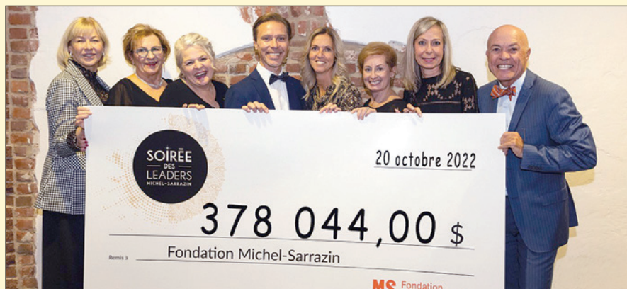
La Soirée des Leaders de la Fondation Michel-Sarrazin Québec recueille 378 044 $.