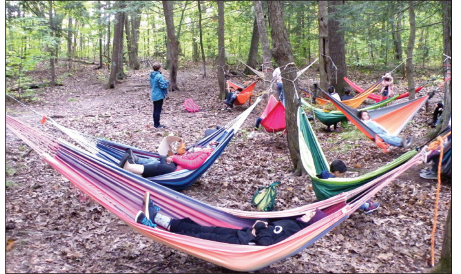
Une quinzaine de bénévoles, ayant installé des hamacs en forêt, ont participé à l'histoire, ont facilité la fabrication d'objets ou ont servi des collations et se sont assurés que toutes les étapes de l'itinéraire soient inoubliables pour les participants.

une activité culturelle gratuite qui fait le bonheur des petits et des grands illustre que notre projet de mise en valeur culturel du boisé correspond à un besoin dans notre communauté », a résumé Denise Leahy. ■