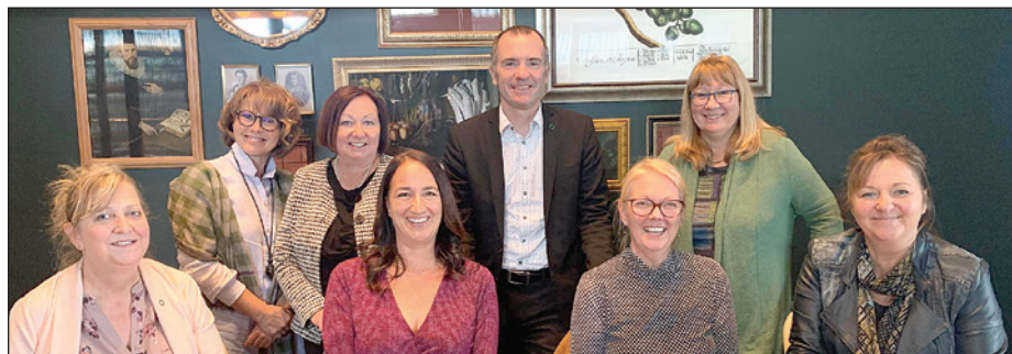
À la Caisse Desjardins de Sainte-Foy, c'est une tradition d'offrir une activité de reconnaissance de service aux employés ayant plus de 15 ans à l'emploi de Desjardins. La caisse a profité de la Semaine de la coopération pour souligner le tout.

À la Caisse Desjardins de Sainte-Foy, c'est une tradition d'offrir une activité de reconnaissance de service aux employés ayant plus de 15 ans à l'emploi de Desjardins. La caisse a profité de la Semaine de la coopération pour souligner le tout. ■