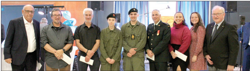
Des représentants d'une partie des organismes aidés par la fondation.

(YG) La 40 e édition du Vins et fromages de la Fondation Richelieu Québec-Ancienne-Lorette a récolté la somme de 26 400 $ récemment. Un montant qui sera remis aux organismes que la fondation supporte tels que le Patro Roc-Amadour, Les Œuvres Jean Lafrance, le Corps de cadets de L'Ancienne-Lorette, la Maison Richelieu, la MDJ de L'Ancienne-Lorette et la Maison hébergement jeunesse de Sainte-Foy. Depuis la fusion des deux Club Richelieu en 2014, l'organisme a remis 100 000 $ aux organismes concernés. ■