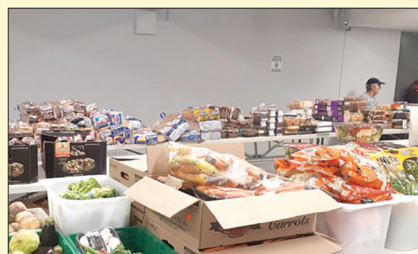
Malheureusement, les demandes augmentent et les denrées alimentaires disponibles sont en baisse.

(YG) L'inflation et la hausse des coûts qui en découle ont un impact direct sur la capacité des ménages à acheter plusieurs articles, notamment la nourriture. Il n'est donc pas surprenant que le nombre de personnes ayant besoin de recourir à une aide alimentaire pour se nourrir soit en hausse.