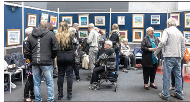
Des visiteurs discutent des œuvres présentées avec les artistes aînés.