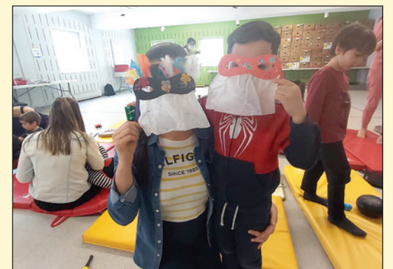
Les activités libres et gratuites destinées pour les 3 à 12 ans de Ressource Espace Familles se poursuivent cet automne!

Aucune inscription requise, vous n'avez qu'à vous présenter directement sur place au Centre de loisirs Sainte-Ursule les jeudis de 15 h 30 à 19 h 30 (spécial sciences) et les dimanches de 10 h à 16 h et au Centre de loisirs de Notre-Dame-de-Foy les lundis de 15 h 30 à 19 h 30 et les samedis de 10 h à 16 h. Pour plus d'informations: www.ressourceespacefamilles.com . ■