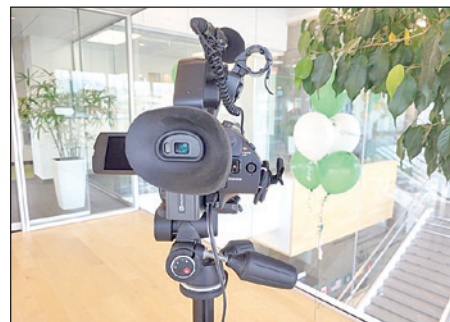
Lors de cette journée, la caisse a interrogé quelques membres qui sont venus rencontrer leur conseiller sur place.

Lors de cette journée, la caisse a interrogé quelques membres qui sont venus rencontrer leur conseiller sur place. Restez à l'affût, ils partageront avec vous le résultat de ces petites entrevues.