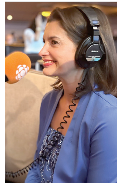
La députée de Louis-Hébert, Geneviève Guilbault, lors de la soirée électorale du 3 octobre dernier.

Beaucoup de travail accompli. « Nous avons livré ce que nous avions promis », termine M me Guilbault. ■