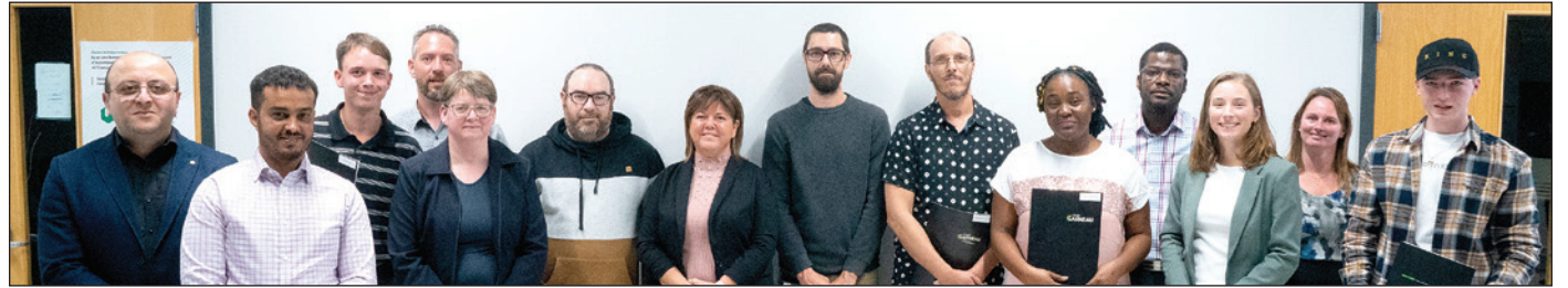
La formation continue du Cégep Garneau a remis récemment un diplôme à la première cohorte d'étudiants qui ont suivi la formation du programme spécialisé en cybersécurité.

(YG) La formation continue du Cégep Garneau a remis récemment un diplôme à la première cohorte d'étudiants qui ont suivi la formation du programme spécialisé en cybersécurité. Les 13 personnes formées possèdent maintenant des compétences à jour pour assurer la protection, la sécurité et l'intégrité de l'ensemble des actifs informatiques et informationnels de leur organisation. Un deuxième groupe débutera le 17 octobre prochain.