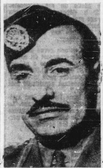
M. HAZZA MAJALI

LONDRES (PA) — Le premier ministre de la Jordanie, M. Hazza Majali, a été assassiné aujourd'hui à son bureau. Une bombe à retardement l'a tué. Une autre bombe a explosé dans un autre bureau du gouvernement à Amman.