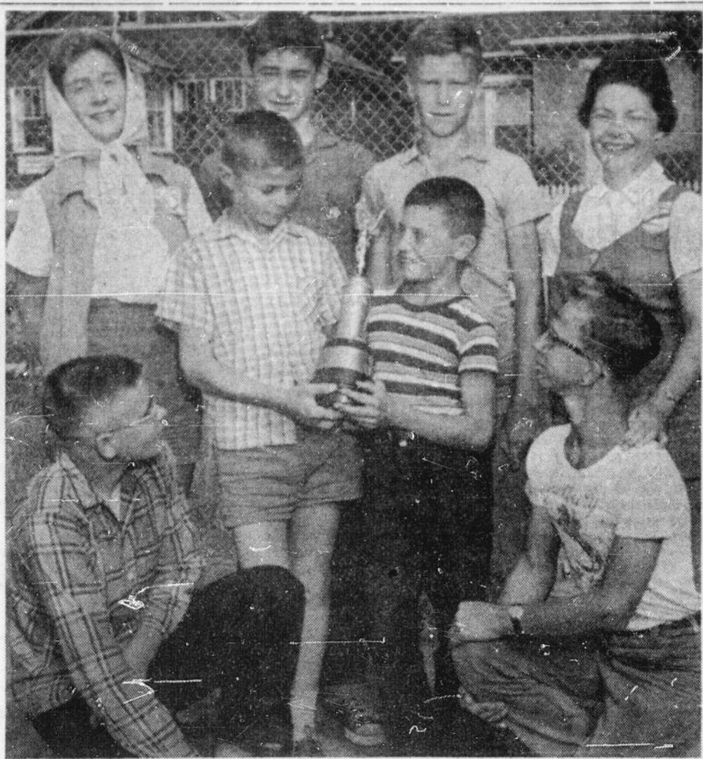
EQUIPE GAGNANTE — L'équipe de piste et pelouse du terrain de jeux Riverside a remporté la victoire lors du concours de piste et pelouse des terrains de jeux de la ville de Sudbury, qui avait lieu sur le terrain du collège Sacré-Coeur. Ce concours était organisé conjointement par les Chevaliers de Colomb de Sudbury et par le comité de récréation de Sudbury. Nous voyons