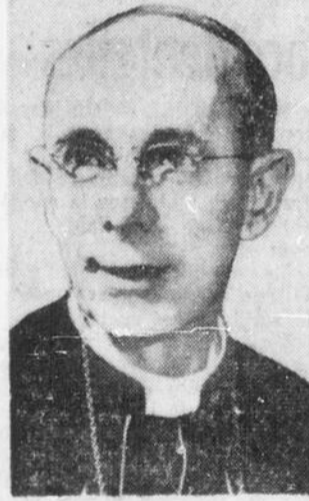
Le cardinal JOHN O'HARA