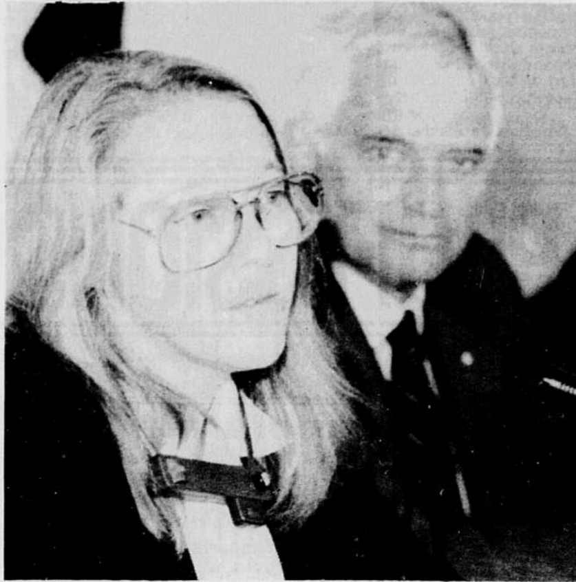
La ministre de l'Énergie des Territoires du Nord-Ouest, Nellie Cournoyea, a avancé plusieurs arguments contre l'Accord du lac Meech, lors du caucus libéral, à Iqualuit. A ses côtés, le chef libéral John Turner.

Bien que M. Wilson a annoncé que la taxe ne s'appliquerait pas aux aliments, les régions éloignées comme les Territoires du Nord-Ouest seront touchées parce que la taxe affectera les frais de transport, déjà très élevés.