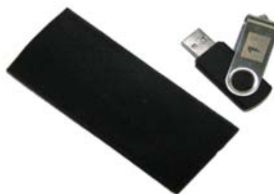
Clé USB (2GB) 13,00 $ (+ taxes)