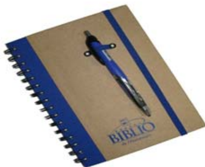
Carnet à spirale et stylo 9,75 $ (+ taxes)

De nouveaux articles promotionnels vous sont offerts. Profitez de l'occasion pour offrir ses articles en cadeau à votre clientèle ou aux membres de votre équipe de bibliothèque. Contactez Unik GiVogue au 819-561-6008 poste 30 ou Benoit Martineau au poste 33 pour commander.