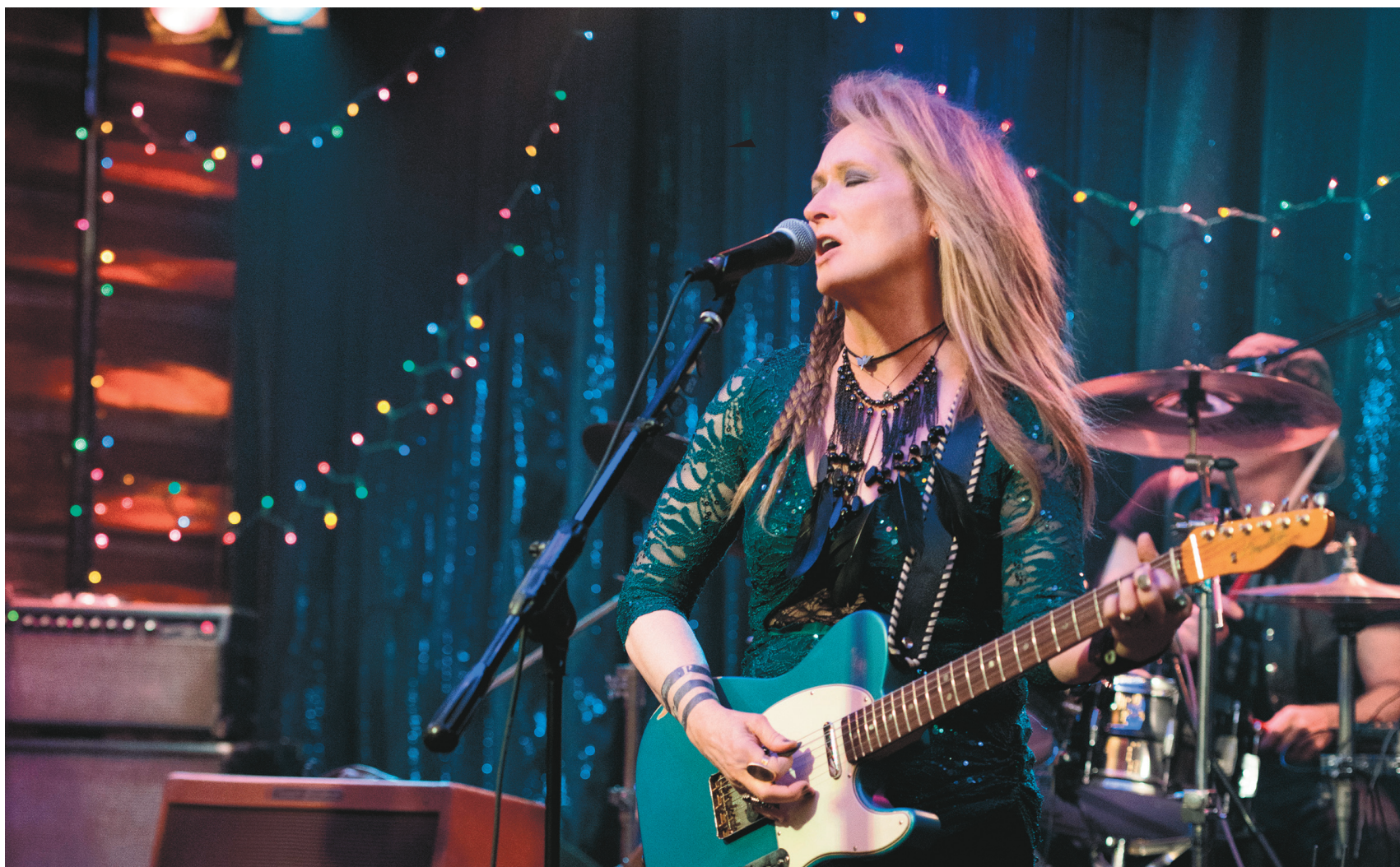
Meryl Streep a appris à jouer la guitare pour le film Ricki and the Flash .

À l'inverse, Ricki and the Flash nécessite un lâcher-prise de la part du spectateur, le film se déployant à son rythme et à sa manière, avec