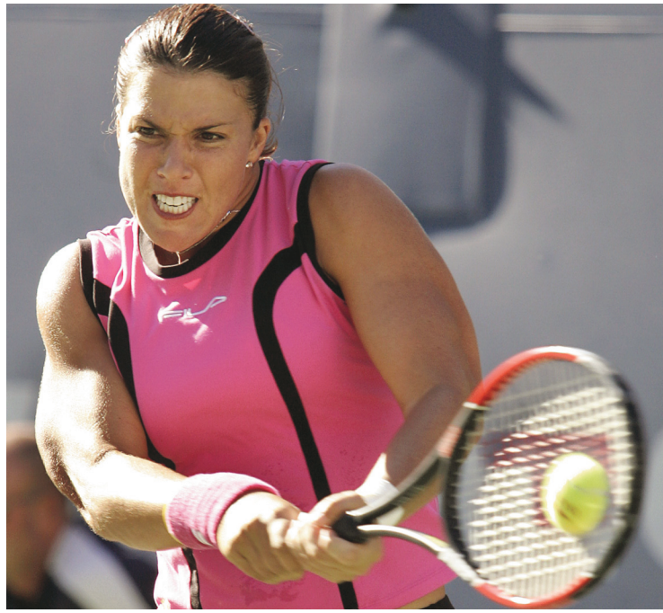
Jennifer Capriati atteint le 8 e rang mondial à 14 ans, mais tombe dans la délinquance, la drogue et l'alcool en réaction aux frasques de son papa mégalomane.

Si l'histoire des sœurs Williams, arrivées au sommet grâce à un père obsédé par leur réussite, semble somme toute plutôt heureuse, il n'en va pas de même de celle d'une foule d'autres joueuses. Véritable prodige précoce, l'Américaine Jennifer Capriati, que son père a mise au tennis à l'âge de trois ans, atteint le 8 e rang mondial à 14 ans, mais tombe dans la délinquance, la drogue et l'alcool à 16 ans, en réaction aux frasques de son papa mégalomane. « A