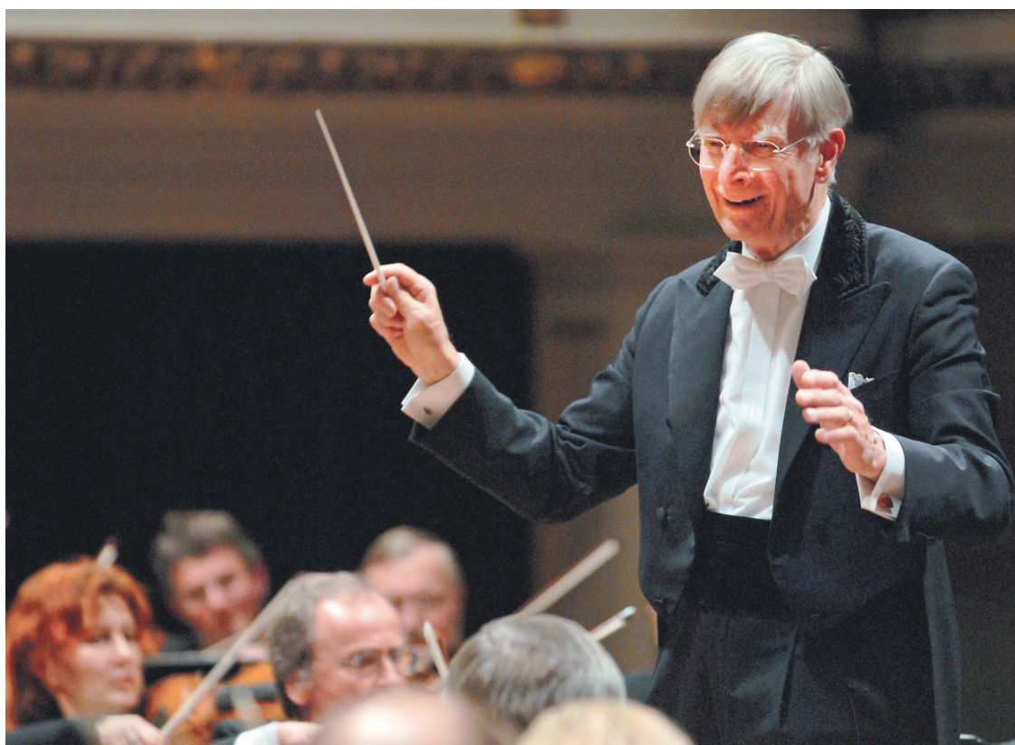
Herbert Blomstedt fut l'un des pionniers de la musique de Carl Nielsen.

Nielsen-Sibelius : et si, des deux, le génie n'était pas celui que l'on croit? La question a été posée, parfois par provocation, mais souvent pour relever que le fossé entre la notoriété de l'un et le relatif anonymat de l'autre n'a pas lieu d'être. Les deux compositeurs ont la même portée, mais Sibelius a habilement utilisé ses 25 ans de vie supplémentaire. Nielsen est mort au moment de l'avènement de l'enregistrement électrique, alors que dans les années 40 et 50, Sibelius, qui ne composait plus, s'est rapproché de nombre d'inter-