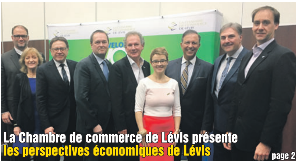
La Chambre de commerce de Lévis présente les perspectives économiques de Lévis