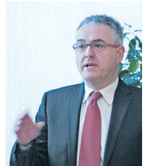
Jean-François Talbot, ministère de l'Économie, de l'Innovation et des Exportations (MEIE).