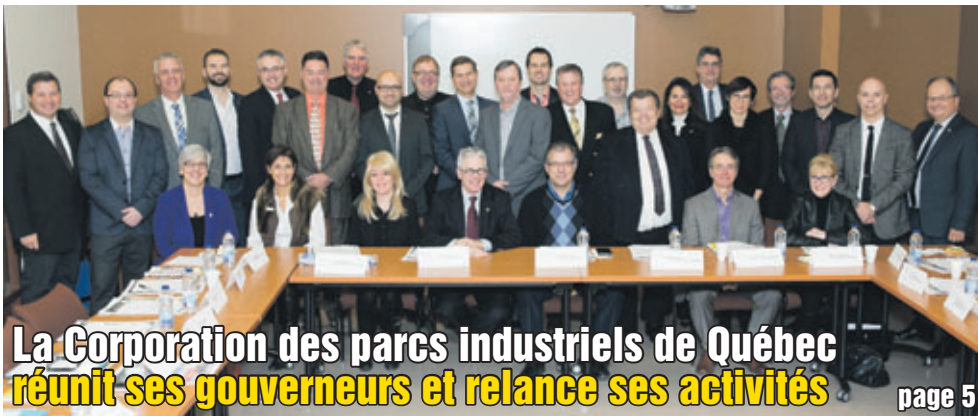
La Corporation des parcs industriels de Québec réunit ses gouverneurs et relance ses activités