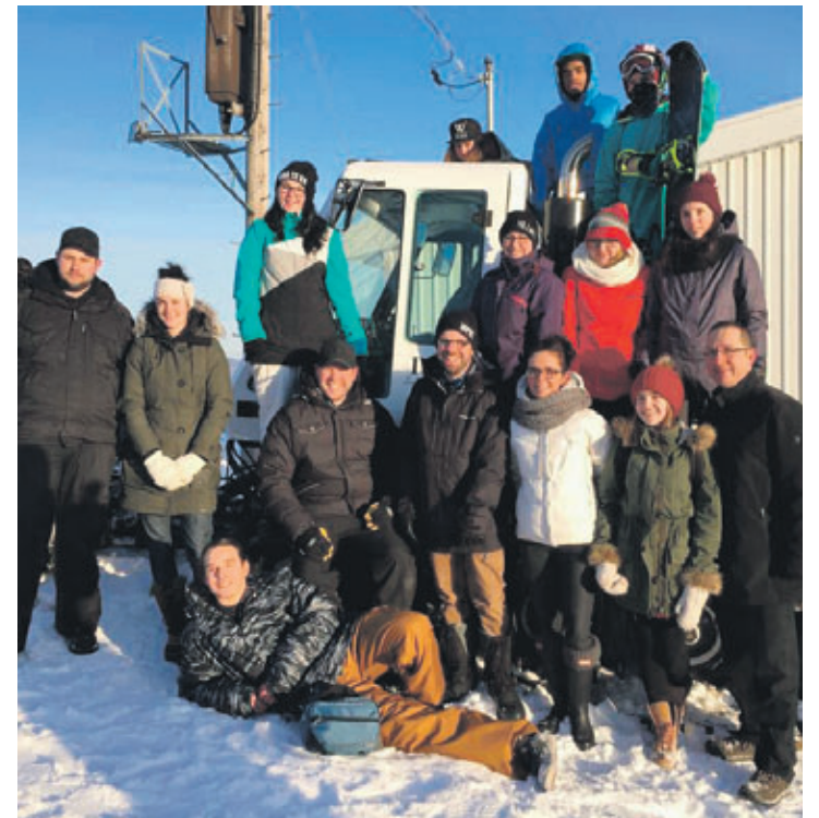
Les partenaires réunis à la suite de la réalisation du projet.

À l'approche du temps des fêtes, le regroupement de gens d'affaires s'était lancé un défi : offrir des cadeaux à toute une communauté, sa communauté. Il n'est pas question ici de dons en argent, mais bien de gestes concrets qui font la différence et qui procurent une expérience humaine à ceux qui donnent comme à ceux qui reçoivent. Ainsi, plus de 45 entreprises ont mis sur pied sept projets dont ils assument l'entière responsabilité financière et organisationnelle. ■