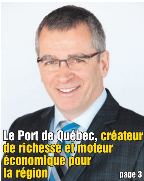
Le Port de Québec, créateur de richesse et moteur économique pour la région