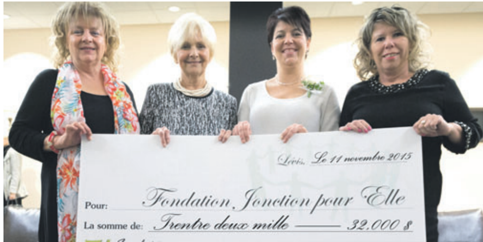
La remise du chèque de la Fondation Énergie Valero aux responsables de la Fondation Jonction pour elle.

La Fondation Jonction pour Elle a pour mission d'amasser des fonds afin de répondre aux besoins matériels et financiers non comblés de la maison d'hébergement Jonction pour Elle et de la maison de transition Denise Ruel, dans le but de venir en aide aux femmes et enfants victimes de violence conjugale dans les MRC Desjardins, Bellechasse, Lotbinière et Nouvelle-Beauce. ■