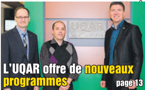
L'UQAR offre de nouveaux programmes