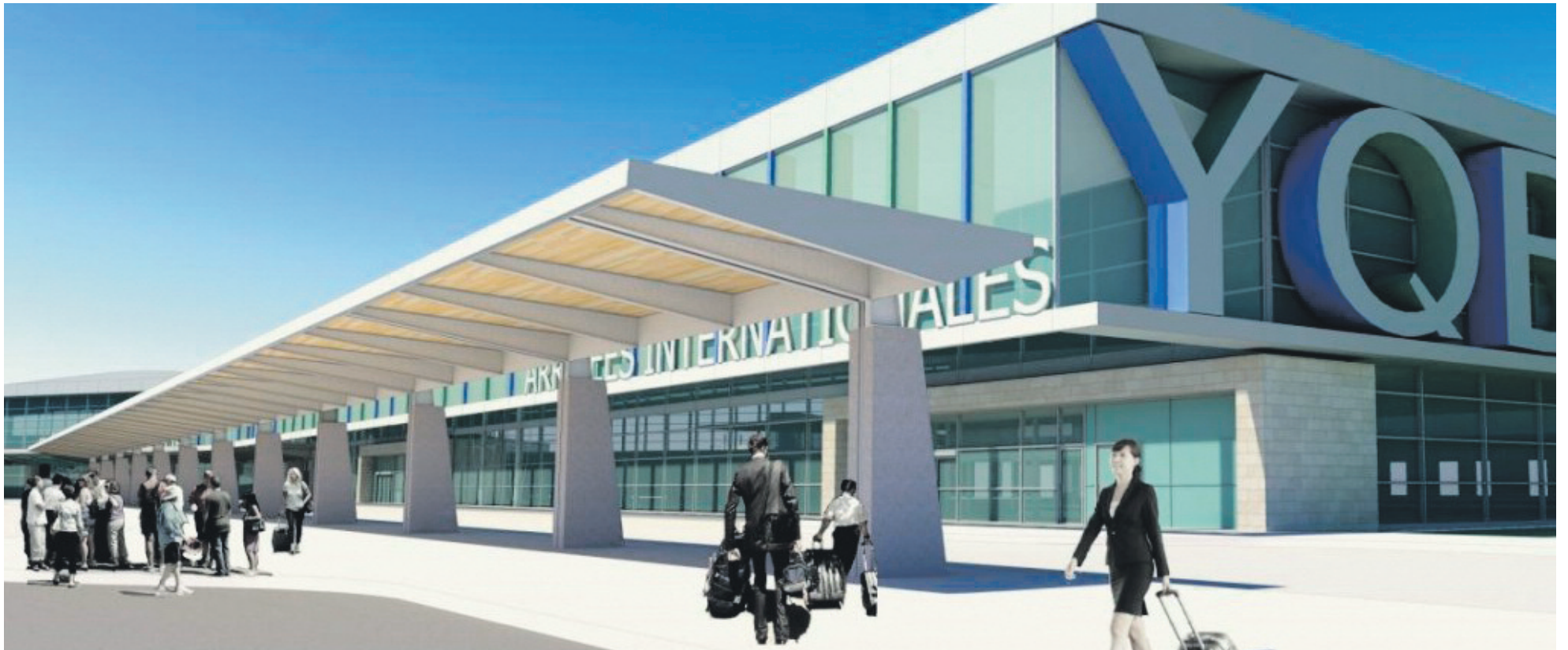
Nouvel abri pour les passagers (maquette)