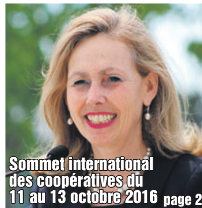
Sommet international des coopératives du 11 au 13 octobre 2016

Le Journal d'affaires | www.journal-local.ca