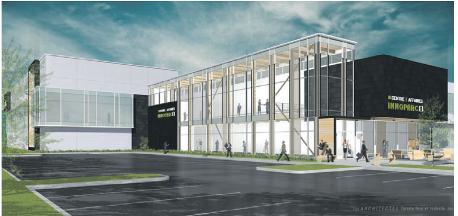
Un bâtiment multilocatif de deux étages, d'une superficie de 2000 mètres carrés dans une première phase, est actuellement en construction sur le site d'Innoparc et permettra d'accueillir dès février 2016 un centre d'affaires avec bureaux partagés et services communs.

« En plus de continuer à encourager la vocation de recherche et le développement en haute technologie, la Ville souhaite ouvrir l'Innoparc à certaines activités commerciales et industrielles, d'où la nouvelle dénomination de zone d'affaires et d'innovation proposée pour cet espace », de conclure M. Gilles Lehouillier, maire de Lévis. ■