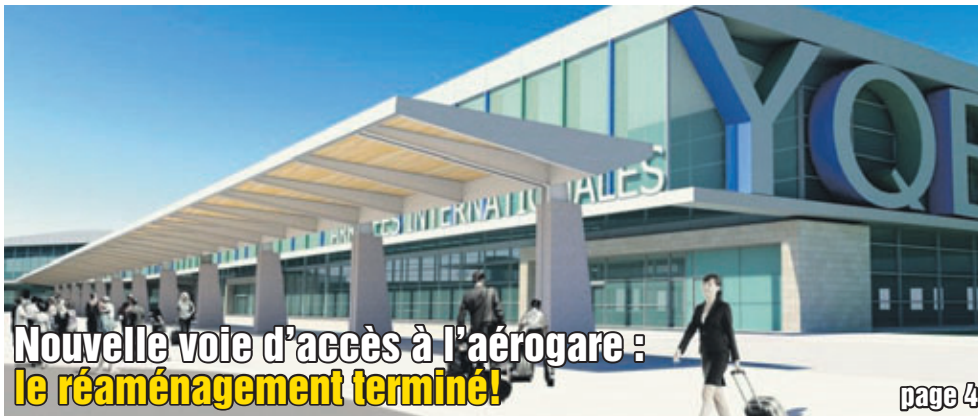
Nouvelle voie d'accès à l'aérogare : le réaménagement terminé!