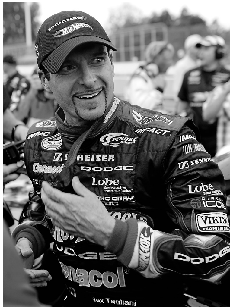
Alexandre Tagliani : « Je suis vraiment fier d'être allé jusqu'au bout en faisant une course propre et en ne commettant aucune erreur. »