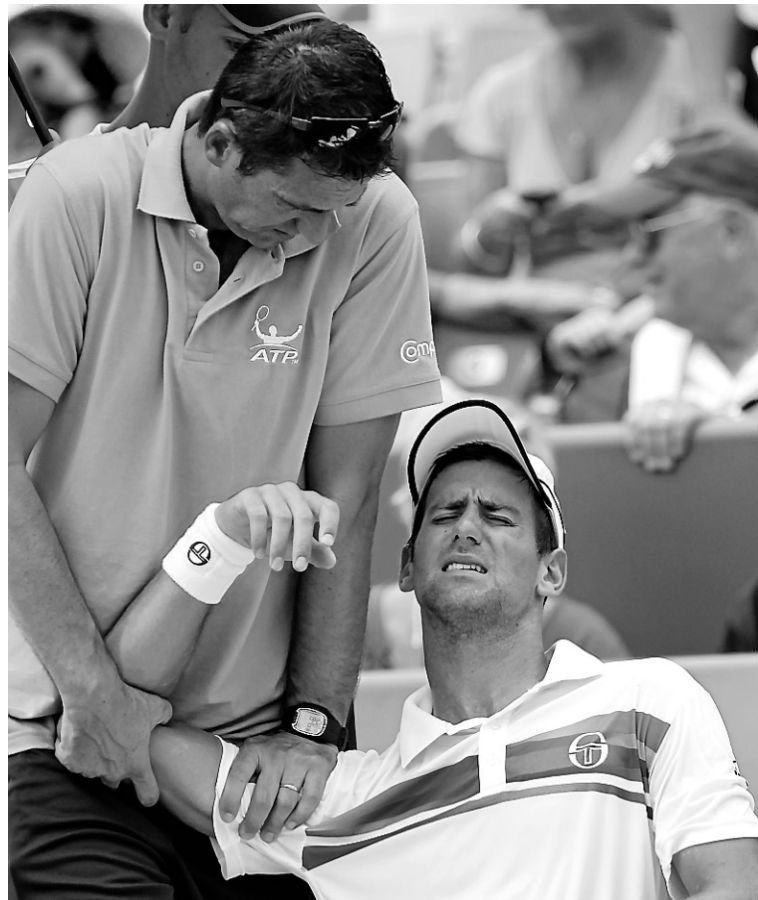
Lorsqu'un spécialiste a poussé avec son pouce sur le rebord de la coiffe du rotateur de Novak Djokovic, hier, ce dernier a grimacé de douleur.

Djokovic semblait incapable d'offrir sa pleine mesure contre le Britannique, qui a savouré son deuxième titre de la saison sur le circuit de l'ATP. Djokovic a demandé l'intervention d'un thérapeute à l'issue de la première manche, étant carrément incapable de cacher la douleur. Djokovic présente néanmoins une incroyable fiche de 57-2 cette saison.