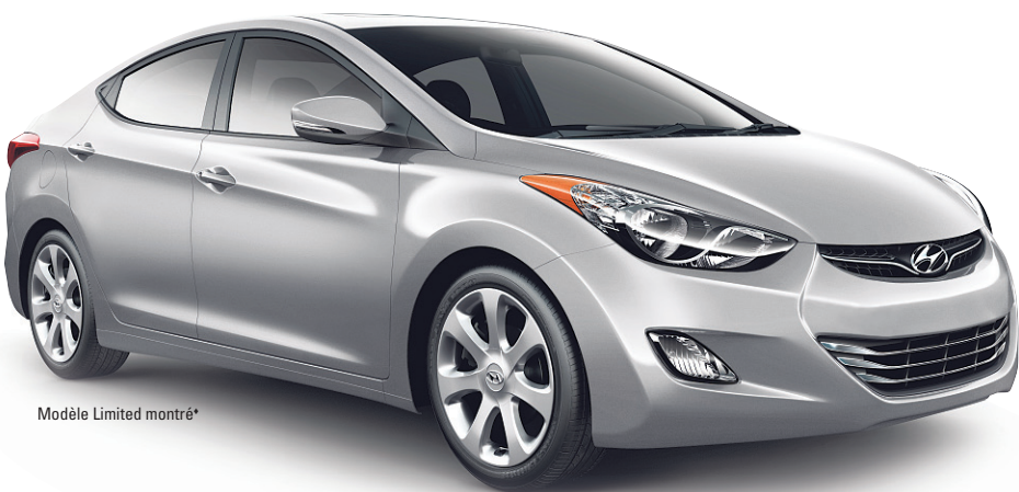
Modèle Limited montré*

3,59% FINANCEMENT À L'ACHAT POUR 84 MOIS ◇ OFFRES DE LOCATION AUSSI DISPONIBLES!