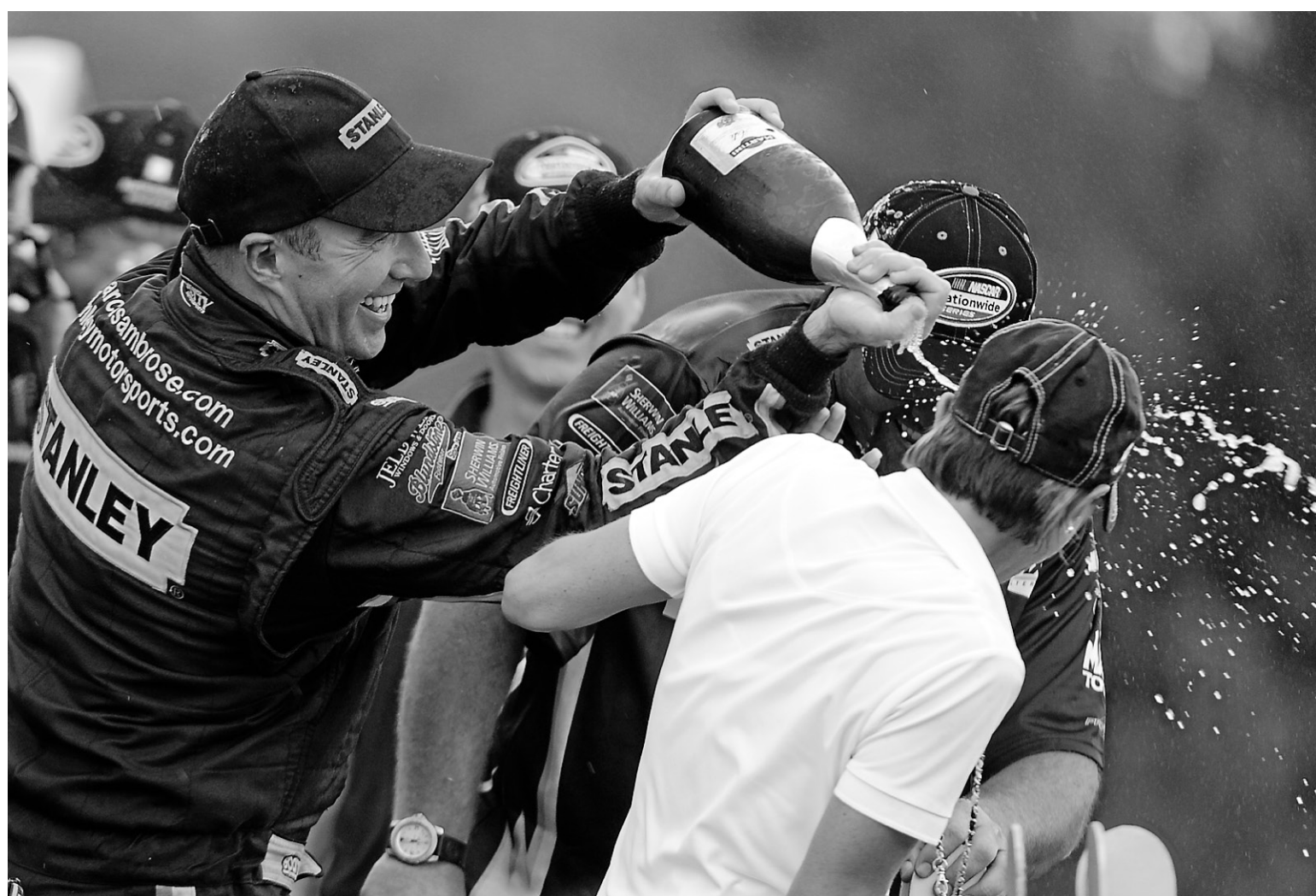
Marcos Ambrose a remporté samedi une quatrième victoire en série Nationwide.