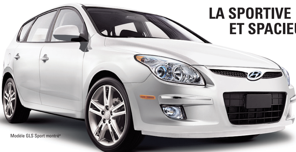
Modèle GLS Sport montré*

3,59% FINANCEMENT À L'ACHAT POUR 84 MOIS ◇ OFFRES DE LOCATION AUSSI DISPONIBLES!