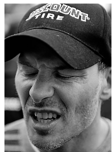
Jacques Villeneuve