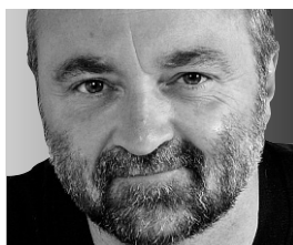
RONALD KING CHRONIQUE

Nos amis de NASCAR sont repartis, sans savoir s'ils vont revenir. Profitons-en pour nous reposer de tous ces gens qui nous expliquent comment la course automobile est importante pour Montréal.