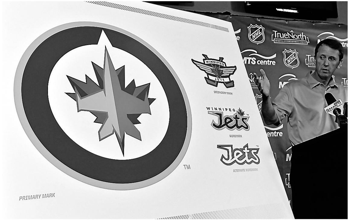
Les Jets de Winnipeg ont succombé à une tendance lourde: associer le sport professionnel aux forces armées. Les nouveaux propriétaires de l'équipe ont créé un logo dont une des variations ressemble illeux aux galons d'un haut gradé.