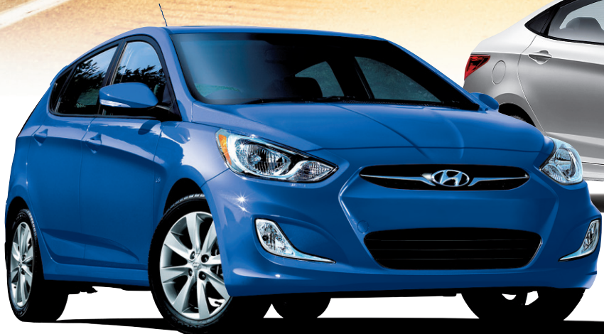
Modèles 4 et 5 portes GLS montrés*

ÉPARGNEZ 30¢/L SUR LE CARBURANT* sur l'Elantra Touring 2011