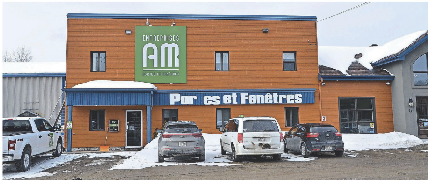
Après 51 ans d'existence, Entreprises AM de Saint-Tite mettra fin à ses activités le 30 juin prochain.