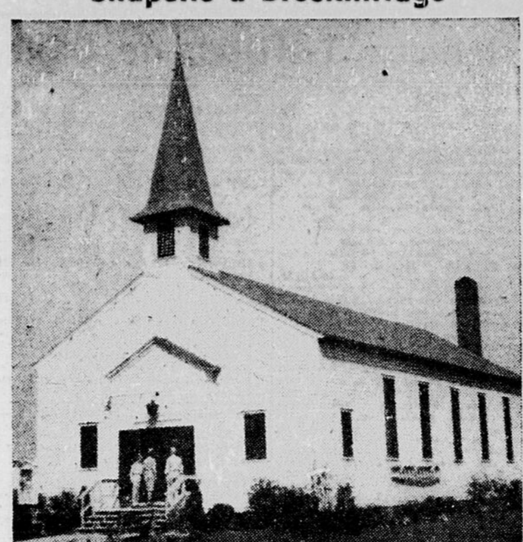
Voici une des douze chapelles du camp de Breckinridge. Elles sont organisées de façon à pouvoir servir aussi bien aux protestants qu'aux catholiques. Elles sont pourvues d'orgues électriques Hammond et de bureaux pour les aumôniers.