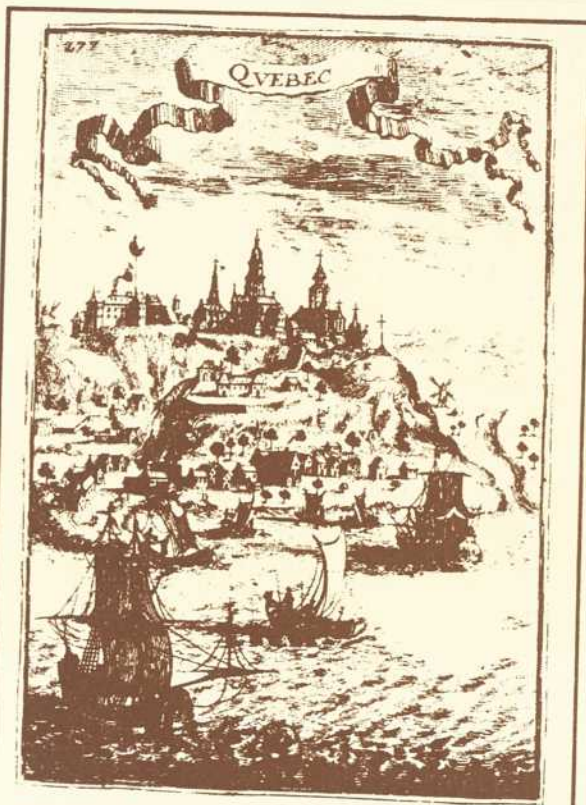
Bibliothèque Nationale du Québec