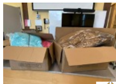
Les Chevaliers de Colomb