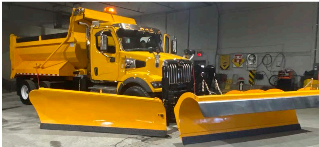
Nouveau camion de déneigement ayant été livré à temps pour l'hiver.

Un nouveau terrain synthétique multisports avec notre école. Une première partie de la rue Industrielle-Nadeau rénovée et dotée d'un sentier actif pour mieux protéger nos familles. Un nouveau camion a été acquis. Tous ces projets et d'autres réalisés sans rajouter un sou à la dette. Merci au personnel municipal pour son excellent travail. Le conseil vous offre ses meilleurs voeux de santé et de prospérité. Merci de votre confiance. Joyeux Noël à vous tous !