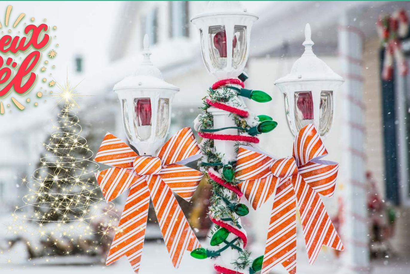
Rue des Écoliers | Novembre 2018