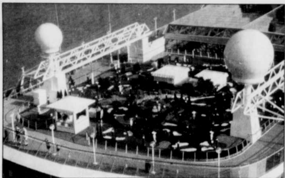
Un parcours amusant, mais qui requiert beaucoup d'habileté. C. PC