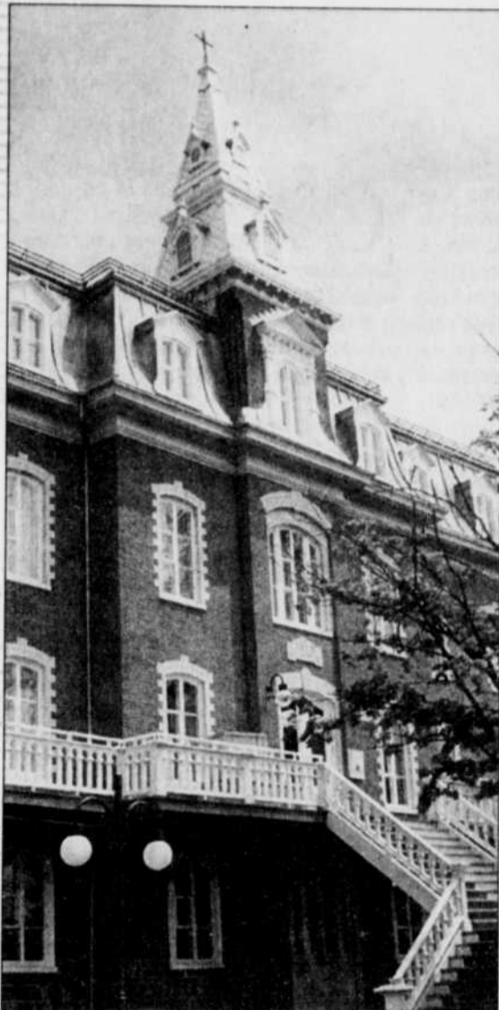
Classé site historique, en 1985, l'ensemble institutionnel de Saint-Joseph regroupe cinq bâtiments à caractère religieux et éducatif. Il s'agit du couvent, (ci-dessus) de style second empire, abritant le Musée Marius-Barbeau et la Société du Patrimoine des Beaucerons, l'église d'esprit néo-classique, le presbytère, de style néo-renaissance française, l'orphelinat et l'école Lambert, face à la rivière Chaudière.

■ SAINT-GEORGES — Théâtre, musée et ensemble institutionnel se combinent pour attirer les touristes de passage à Saint-Joseph de Beauce.