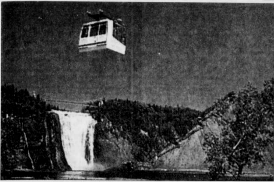
« On fait le tour du Québec »