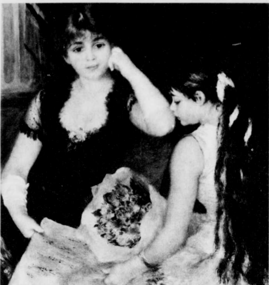
Pierre-Auguste Renoir, « Au concert » (1880)