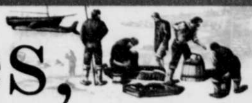
Dépeçage des baleines sur l'île aux Basques, vers 1580.

Un parc thématique aux Trois-Pistoles présente des indices de la présence basque en Amérique avant Jacques Cartier