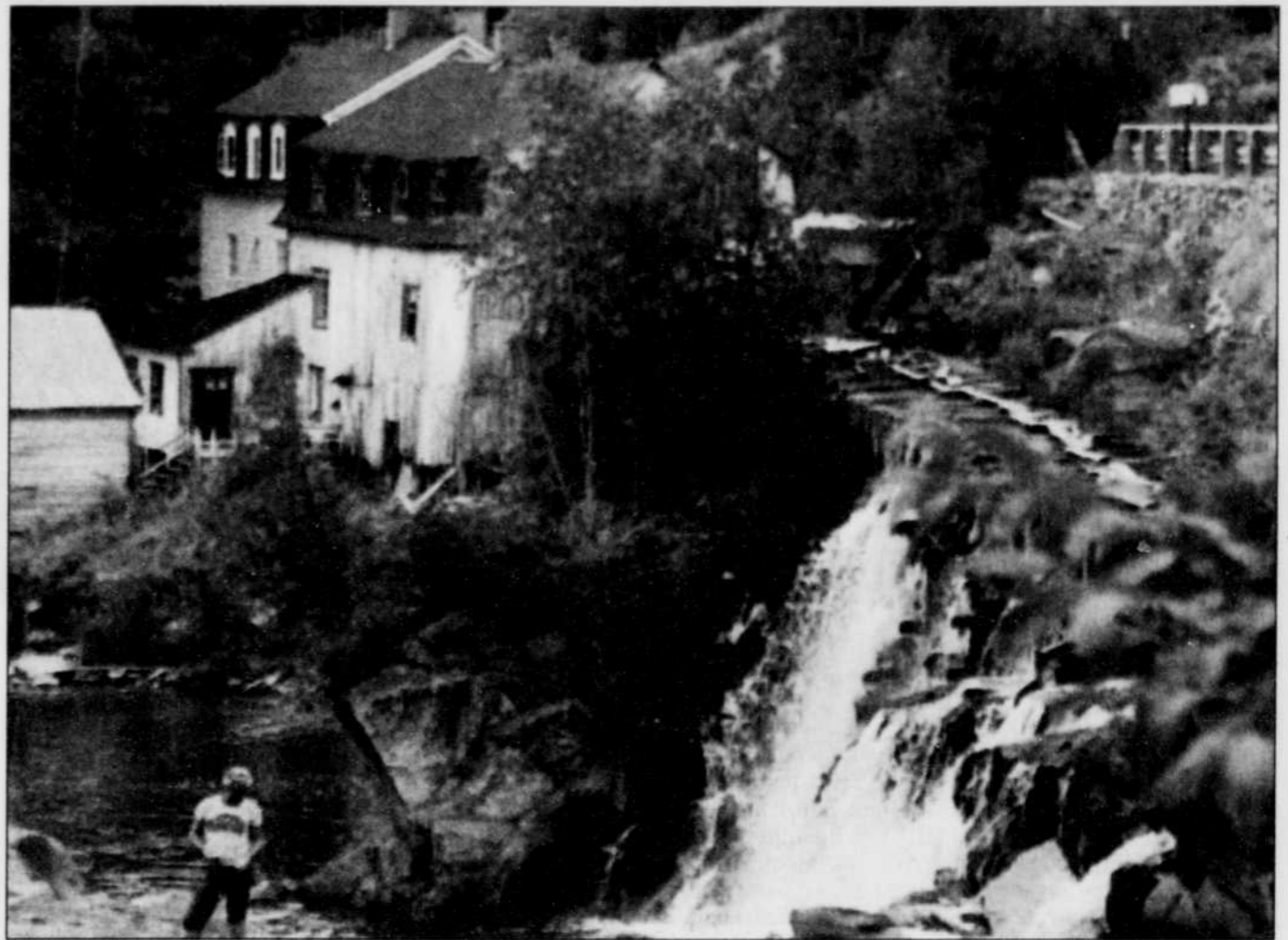
Le moulin Beaulieu, construit en 1874, sur la rivière Trois-Pistoles, à Saint-Clément.

À la fin de l'été, du 22 au 25 août, ce sera un retour au théâtre avec le Théâtre de par chez-nous avec les comédiens Guy Godin et Jean-Louis Millette.