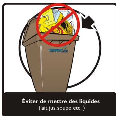
Éviter de mettre des liquides (lait, jus, soupe, etc.)