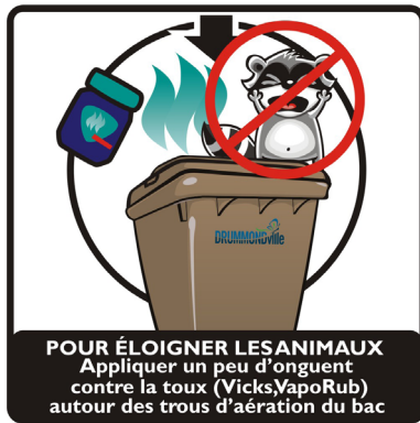
POUR ÉLOIGNER LES ANIMAUX Appliquer un peu d'onguent contre la toux (Vicks VapoRub) autour des trous d'aération du bac