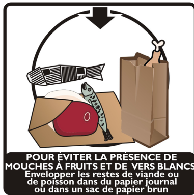
POUR ÉVITER LA PRÉSENCE DE MOUCHES À FRUITS ET DE VERS BLANCS Envelopper les restes de viande ou de poisson dans du papier journal ou dans un sac de papier brun