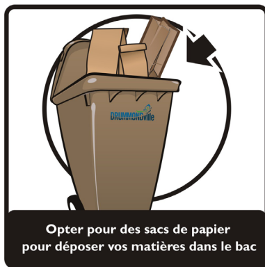
Opter pour des sacs de papier pour déposer vos matières dans le bac