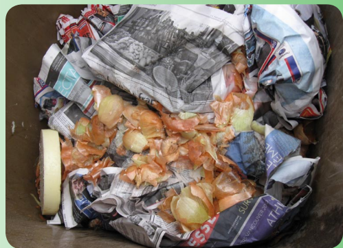
L'utilisation de papier journal peut faciliter l'entretien du bac.