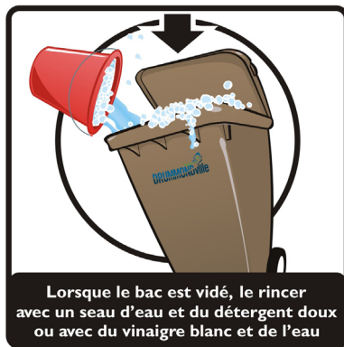
Lorsque le bac est vidé, le rincer avec un seau d'eau et du détergent doux ou avec du vinaigre blanc et de l'eau