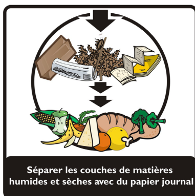
Séparer les couches de matières humides et sèches avec du papier journal

Les résidus verts et les résidus alimentaires sont les principales matières que vous pouvez déposer dans votre bac brun. Ces matières dites organiques se décomposeront et seront transformées naturellement en compost. L'aide-mémoire ci-contre vous en apprendra davantage à ce sujet. Il faut noter que votre bac brun n'est pas un composteur domestique. Il ne sert qu'à entreposer les matières en vue de la collecte. Le traitement de celles-ci se fera chez Fafard et frères de Saint-Bonaventure.