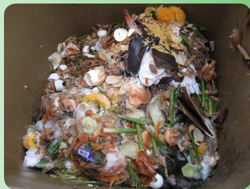
Un exemple des matières qui peuvent être déposées dans le bac brun.