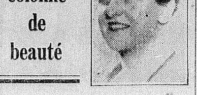
BELLE CHEVELURE... JOLIE FEMME