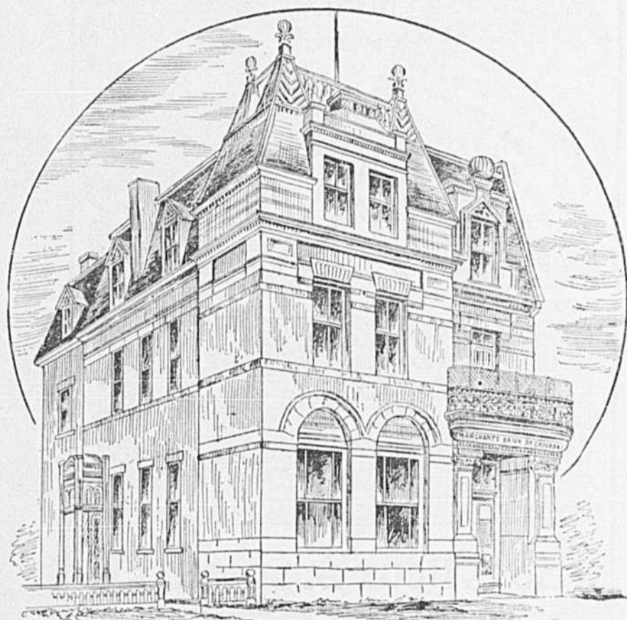
EDIFICE DE LA BANQUE DES MARCHANDS A SAINT-JEROME