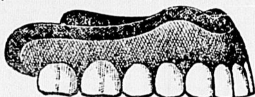
NOS DENTIERES SONT FAITES PAR DES EXPERTS

Nous avons vingt cabinets privés, antiseptiques d'une propreté parfaite, et pourvus d'appareils les plus modernes. Nous prions le public de nous faire une simple visite; il s'étonnera de notre merveilleuse installation électrique qui n'a de rivales qu'à Chicago et à New-York.