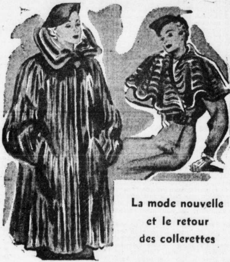
La mode nouvelle et le retour des collerettes

J'aime les clairs réveils de décembre; on dirait, Tant à de pureté le regard de l'aurore, Que les Noël de mon enfance y rient encore. Le paysage, blanc sur bleu, dont chaque trait A la précision des gravures sur cuivre Est l'oeuvre fine et méticuleuse du givre. Tels seront les décors d'hiver au paradis! Mon âme s'émerveille, et danse, et applaudit. Et je Vous cherche, au fond du matin qui blanchit. Seigneur, pour Vous montrer, comme un trésor, ma joie! Camille MELLOY