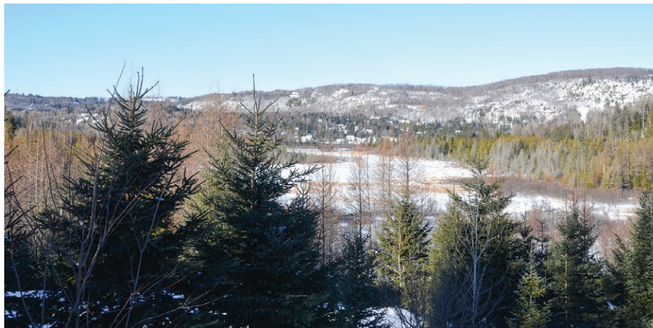
Le parc du mont Christie est un terrain de 1,6 million de pieds carrés dans le domaine du Mont-Christie.

Le groupe de citoyens demande donc « davantage de transparence et d'engagement public dans le processus décisionnel lié à ce projet ». « Il est essentiel que les préoccupations et les perspectives des résidents qui seront directement affectés par le développement proposé soient entendues et prises en compte. » Ils demandent la tenue d'un forum public ou d'une réunion communautaire.