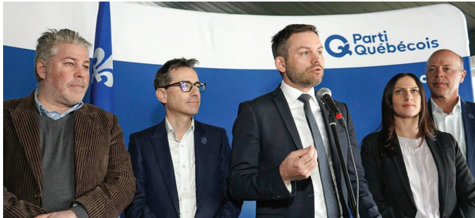
Le chef Paul St-Pierre Plamondon accompagné des députés Pascal Bérubé, Pascal Paradis et Joël Arseneau et de Méganne Perry Mélançon, porte-parole nationale du Parti Québécois.

Le plan du Parti Québécois se décline en sept actions à mettre en place dès que possible. Selon la formation indépendantiste, l'objectif est de répondre aux besoins immédiats des entreprises, puis de mettre en place des mesures structurantes pour l'écosystème médiatique québécois.