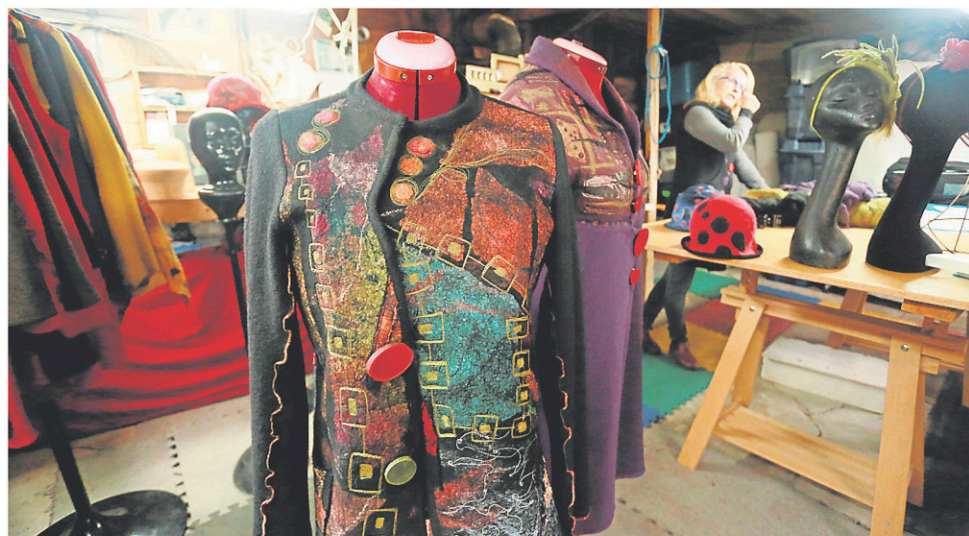
Des oeuvres signées Élisabeth Wannaz.