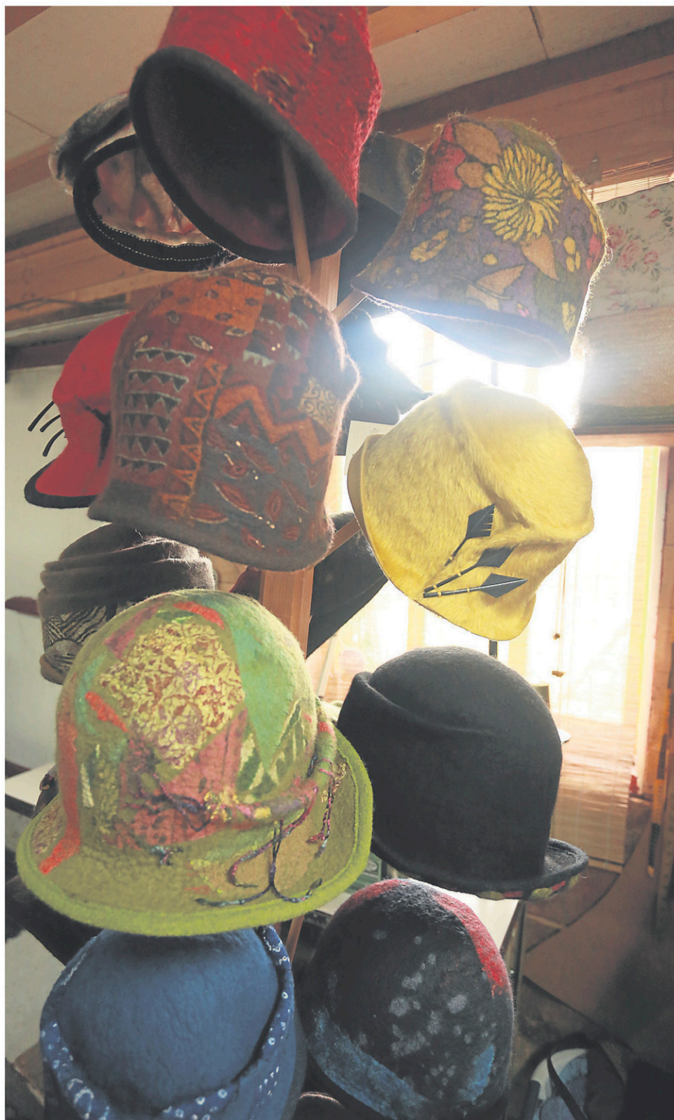
Son chapeau fétiche: la cloche, un bonnet issu des années 1920, qui tombe bien sur la tête et qui donne un air taquin à ceux qui le portent.