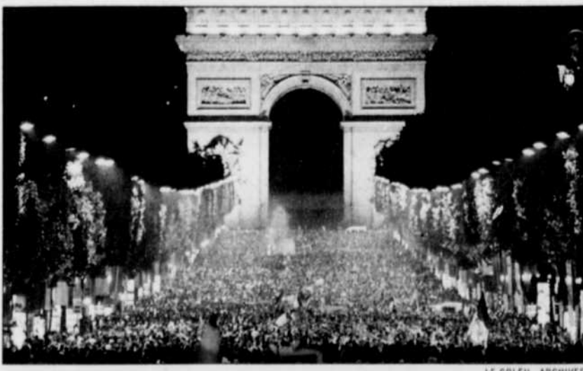
Les Champs-Élysées étaient très achalandés après la victoire de la France contre le Brésil lors de la Coupe du monde de football. Mais il est loin le temps de la tranquillité puisque le tourisme est en hausse dans ce pays.

Le recul du nombre de vacanciers étrangers, qui a atteint dans certains pays près de 15% (Angleterre, Italie, Espagne), a été compensé en partie par l'arrivée d'une nouvelle catégorie de touristes à revenus plus élevés. La Coupe du monde a généré «pour la première fois en France» un fort afflux de touristes latino-américains, brésiliens notamment.