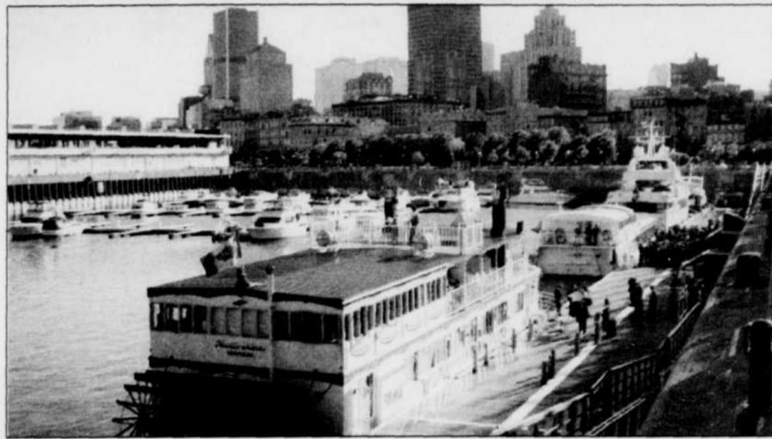
Montréal multiplie les démarches pour attirer les touristes gays.

américains consacrent une plus grande partie de leurs revenus au voyage que les hétérosexuels, probablement parce qu'ils n'ont pas de famille à faire vivre. Ils prennent aussi des vacances plus souvent, et voyagent davantage à l'extérieur du pays - 14 % des homosexuels, par rapport à 4 % du reste des Américains. Comme New York, Amsterdam ou Sydney, Montréal est considérée depuis longtemps comme une ville « gay-friendly » où les touristes reviennent plusieurs fois.