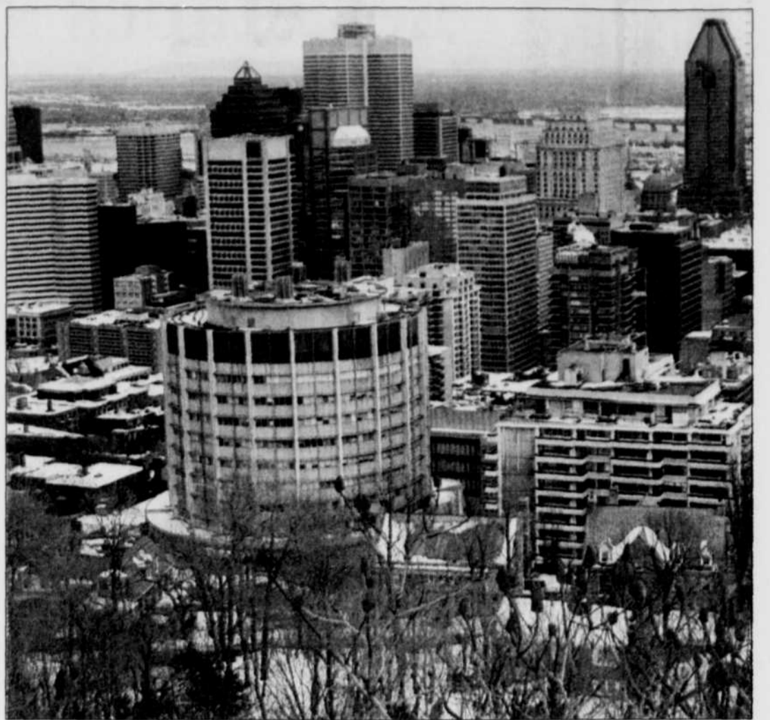
En mai, un congrès de l'Association internationale des voyageurs gays et lesbiennes a réuni 300 d'entre eux à Montréal.

Ils sont riches, voyagent beaucoup et aiment faire la fête à Montréal