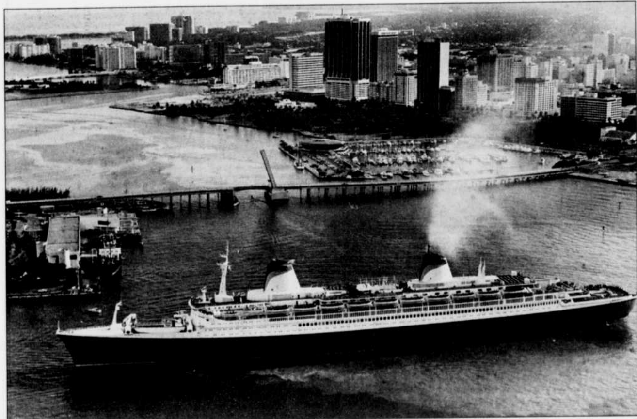
Du country en mer