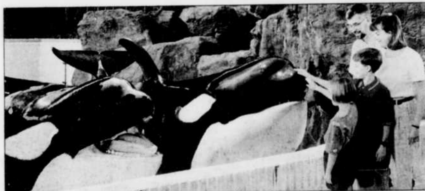
« Tout le monde aime Marineland »

Option Art, une entreprise vouée à la promotion de l'art canadien à travers le monde, vient de lancer la troisième édition de la « Carte de l'art au Québec », un guide gratuit des ateliers d'artistes, des galeries et des musées québécois. On y met en relief les diverses régions de la province pour inviter les touristes à ajouter une touche artistique à leurs parcours. Les auteurs n'oublient évidemment pas les grands événements régionaux relevant de l'art et dont le calendrier apparaît ce mois-ci sur le site www.option-art.ca. Imprimé à 200 000 exemplaires, le document est disponible dans les centres d'information touristique et les bureaux de l'Association canadienne de l'automobile.