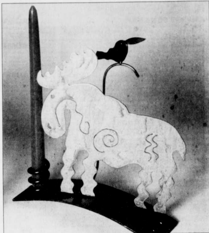
Sur les routes de l'art

Les fans de Picasso qui passeront par Londres du 17 septembre au 16 octobre seront bien servis: plus de 200 céramiques réalisées par le célèbre peintre et dont les deux tiers n'ont jamais été présentées auparavant seront en effet exposées au Royal Academy. «Picasso: Painter and Sculptor in clay» est la plus importante exposition d'oeuvres en argile réalisées par l'artiste 30 ans avant sa mort. Empruntés pour la plupart à des collections privées, les objets exposés sont des oeuvres sculptées et modelées par Picasso lui-même, des modèles exécutés par des artistes locaux suivant les instructions du maître ou encore des formes préexistantes. Le prix du billet d'entrée est d'environ 15$ pour les adultes et de 13$ pour tous ceux ayant droit à des tarifs réduits. Renseignements: 0171-300-8000.