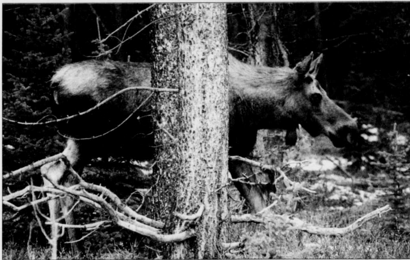
L'original, seul et solitaire, marche tranquillement et habilement à travers les épinettes de la forêt. Le regard des hommes ne le dérange guère, trop occupé qu'il est à se nourrir du pâturage.