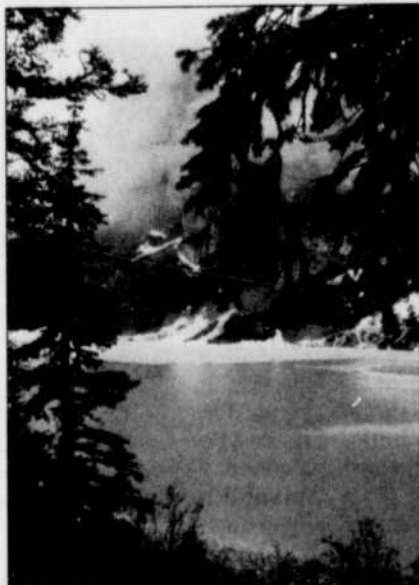
Les eaux glaciales du lac Peyto, au nord du lac Louise

Des arpens et des arpens de bois qui fuient au-delà de l'horizon