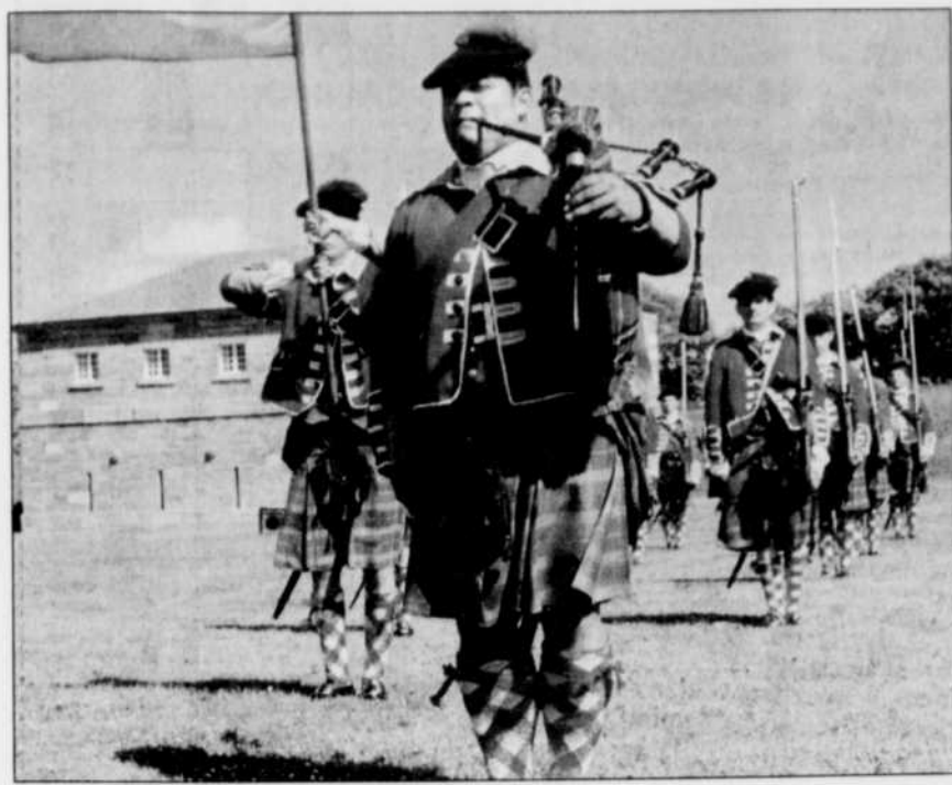
Manoeuvres en musique

Si, par hasard, vous vous trouvez demain dans la région de Montréal et que vous vous demandez quoi faire de votre temps libre, Parcs Canada vous convie aux Beaux-Dimanches de Fort-Lennox pour assister au spectacle offert par les Fraser Highlanders, un régiment d'origine écossaise qui exécute ses manoeuvres au son de la cornemuse. En plus de voir défiler ces hommes en kilts, vous pourrez également assister à des démonstrations de tirs au mousquet et à un spectacle présenté par les danseurs de la troupe. Les manoeuvres en musique se dérouleront entre 13h et 16h et les visites guidées des lieux à toutes les heures. Si, comme moi, vous demandez qui sont ces Fraser Highlanders, voici leur petite histoire. Également connus sous le nom de 78 e Régiment, ils ont été recrutés en 1757 par Simon Fraser à la demande du roi Georges II. Ils ont participé à plusieurs événements, dont la célèbre bataille des plaines d'Abraham, avant d'être démobilisés en 1763. Quelque 200 d'entre eux s'établirent par la suite au Québec et y fondèrent famille. On en retrouve encore aujourd'hui des descendants dans la région de Rivière-du-Loup, qui ont comme nom Ross, Fraser, McNabb, etc. Pour plus amples renseignements, faites le (450) 291-4389.