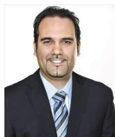
Aziz Guellouz Commissaire aux entreprises et à l'innovation