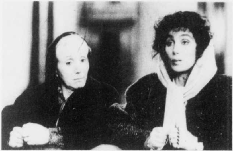
Olympia Dukakis, à gauche, et Cher sont sorties gagnantes de leur prestation dans "Eclair de lune".

Depuis sa mise en nomination, elle s'est permis de refuser deux offres pour des séries télévisées. Elle a tout de même accepté de tenir un petit rôle dans le film de Mike Nichols "Working Girls", mais ses agents lui présentent un bel avenir cinématographique.