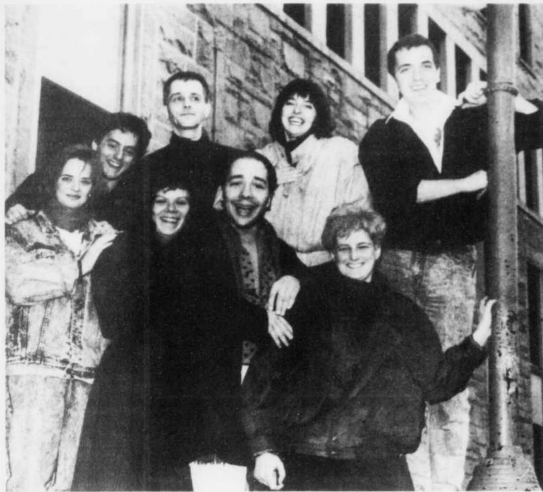
L'équipe de distribution et de production de la pièce "Les larrons font l'occasion", présentée cet été par la Troupe à Wilfrid de Victoriaville.

son est telle que la troupe, malgré les recettes anticipées et une hausse du prix du billet, mijote une campagne de financement sous la direction de gens d'affaires locaux, pour boucler son budget.