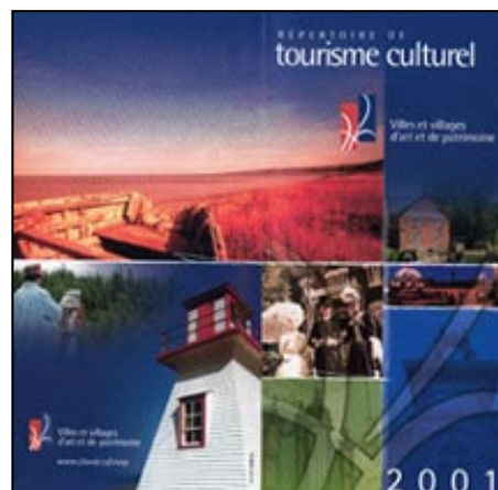
Répertoire de tourisme culturel - WAP

Environ 30 % des églises interrogées organisent plus stratégiquement l'annonce de leur accessibilité. Certains lieux de culte distribuent des dépliants dans des lieux d'hébergement, des sites touristiques et autres lieux de culte de la région.