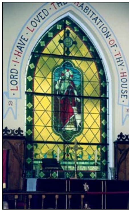
Église St.Bartolomew, Rivière-du-Loup

L'embauche d'un agent culturel grâce au programme Villes et villages d'art et de patrimoine (VVAP) a certes favorisé l'appropriation des projets en patrimoine religieux par les élus municipaux et les partenaires locaux dans plusieurs régions du Québec. Dans Portneuf, cette préoccupation des élus municipaux pour la sauvegarde et la mise en valeur de ce patrimoine significatif a même été enchâssée dans la politique culturelle régionale et dans la révision du schéma d'aménagement.