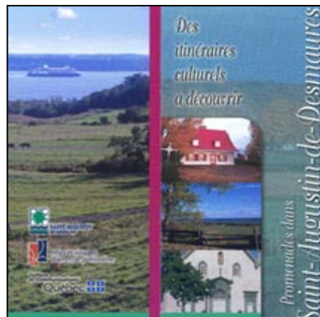
Promenades dans Saint-Augustin-de-Desmaures

Les partenaires de la CPTRQ bénéficient d'un excellent réseau de promotion grâce au kiosque d'information situé sur le parvis de la basilique-cathédrale Notre-Dame-de-Québec, grâce aussi au site Internet de la Corporation, aux vidéos promotionnelles qu'elle produit, aux napperons qu'elle distribue dans des restaurants du Vieux-Québec, à la distribution de son guide À la découverte du patrimoine religieux de Québec et à l'envoi ciblé de matériel d'information aux grossistes en voyage, clubs sociaux et écoles. De plus, chacun des partenaires de la Corporation possède un présentoir permettant la distribution des dépliants d'autres lieux patrimoniaux membres du réseau.