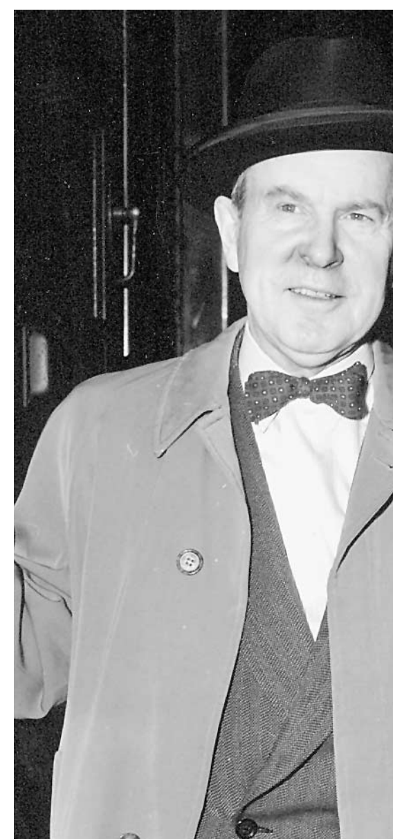
Lester B. Pearson