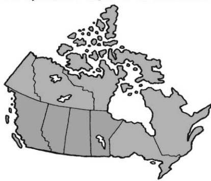
2005 - NOT TO BE OUTDONE, THE WEST QUICKLY VOTES TO SECEDE.