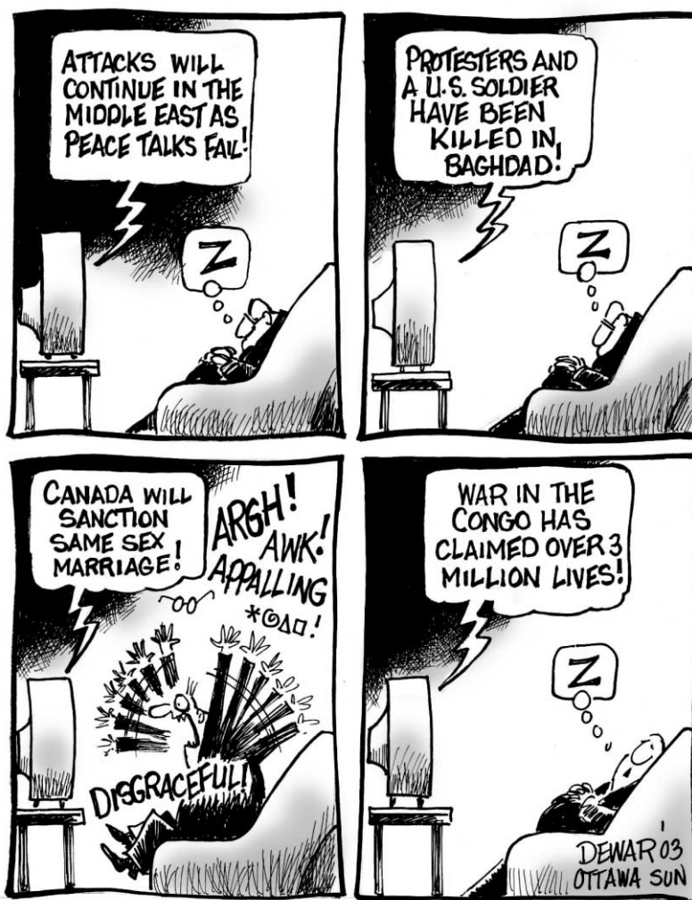
Dessin de Sue Dewar du Ottawa Sun .

servent la plus grande circonspection lorsque vient le temps de parler des Acadiens. Souvenons-nous, à la Chambre des communes, du triste épisode de la demande d'excuses officielles à la Couronne britannique suite à la Déportation de 1755. Non, les députés de l'Alliance canadienne n'ont pas eu à s'en mêler. Ils ont laissé des adver-