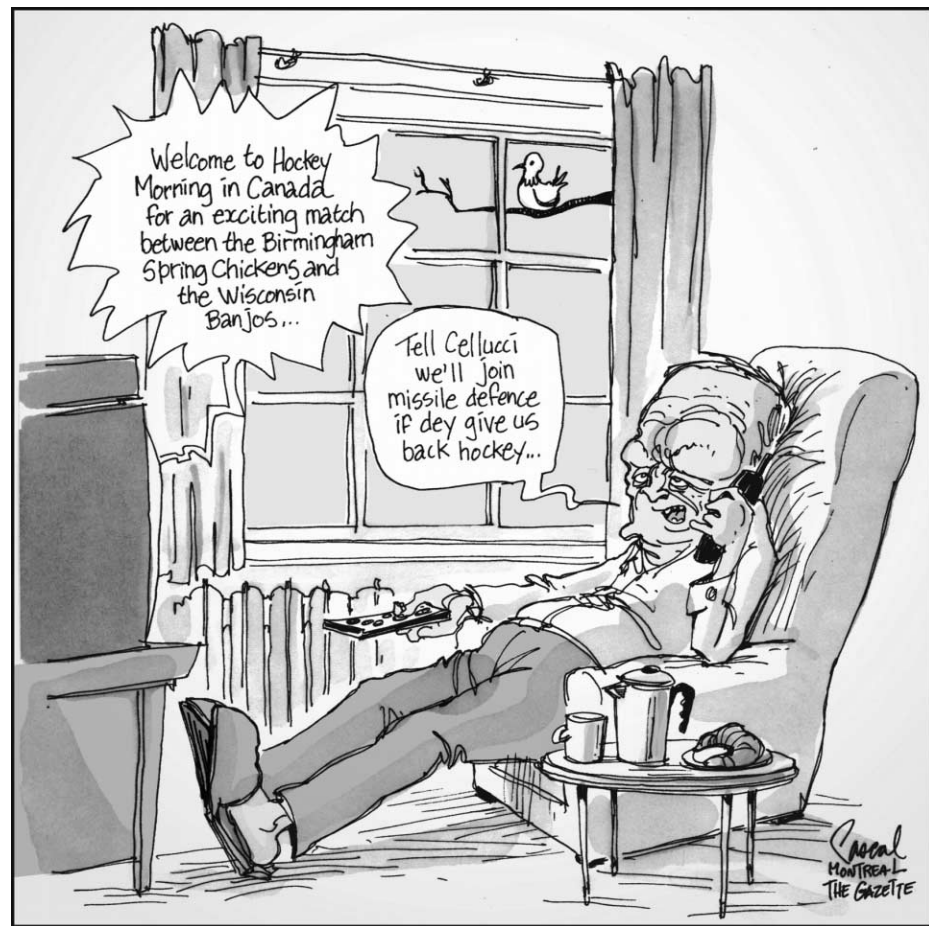
Dessin de Pascal Élie paru dans The Gazette.