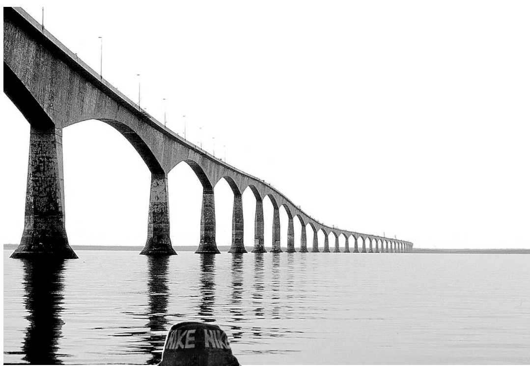
Le pont de la Confédération