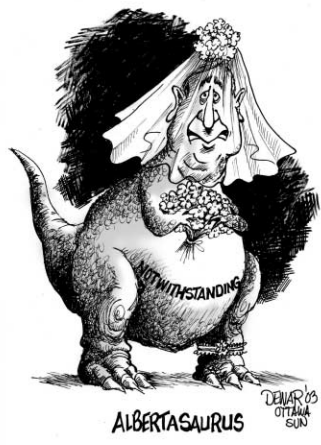
Dessin de Sue Dewar paru dans le Ottawa Sun.

Tout cela était bien entendu très pratique d'un point de vue politique. En effaçant l'encombrant héritage de notre passé et en le remplaçant par l'anonymat du modernisme, le Canada (et je parle