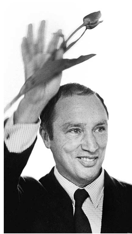
Pierre Elliott Trudeau