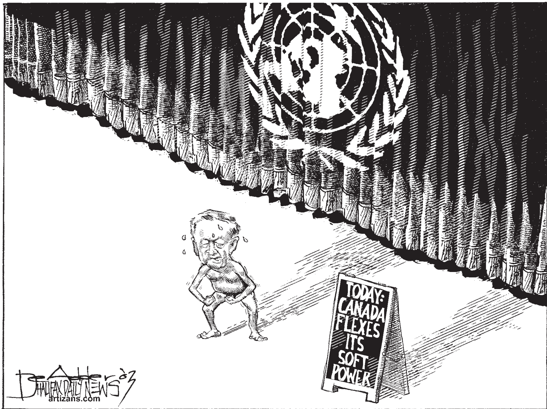
Dessin de Michael Deadder, du Halifax Daily News .