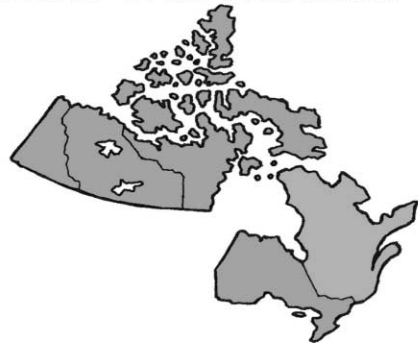
2006 - TIRED OF CARRYING THE NATION, ONTARIO SEPARATES, IMMEDIATELY FOLLOWED BY THE TERRITORIES.