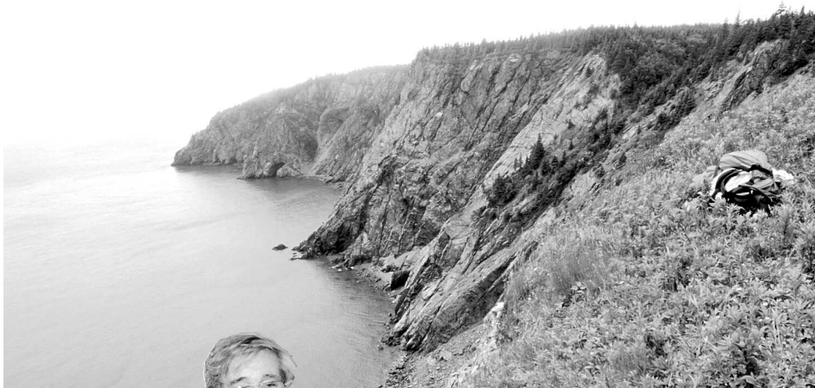
La baie de Fundy