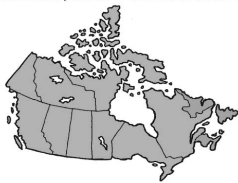
2004 - NEWFOUNDLAND (AND THE REST OF THE EAST) LEAVES CONFEDERATION.