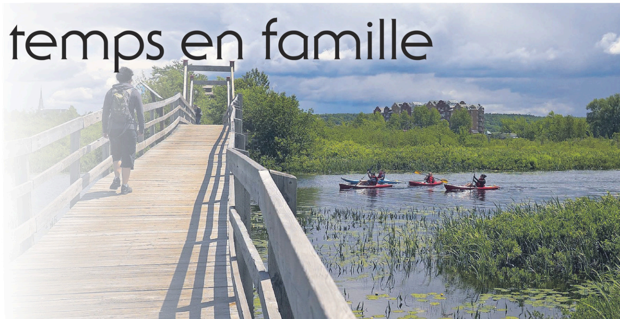
Le marais de la rivière aux Cerises et ses sentiers sur pilotis sont un incontournable pour une belle balade en famille.

« MAISON MERRY ». Il s'agit de la dernière nouveauté dans la région. Cette maison est considérée comme