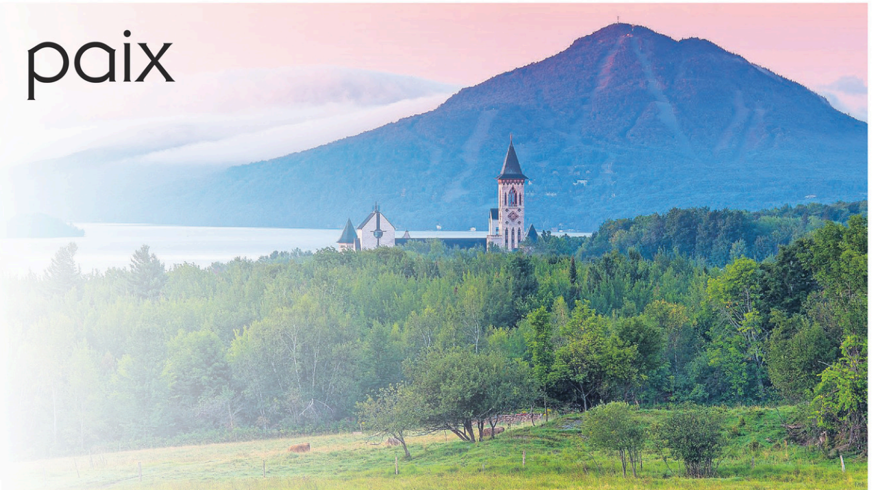
L'Abbaye Saint-Benoît-du-Lac est un lieu de culte tout droit sorti d'un autre monde.

Pour vivre quelque chose de vraiment différent, il faut absolument faire un détour à l'Abbaye Saint-Benoît-du-Lac. Ce lieu de culte, où habitent des moines, est tout droit sorti d'un autre monde. Non seulement l'architecture est impressionnante, mais l'am-