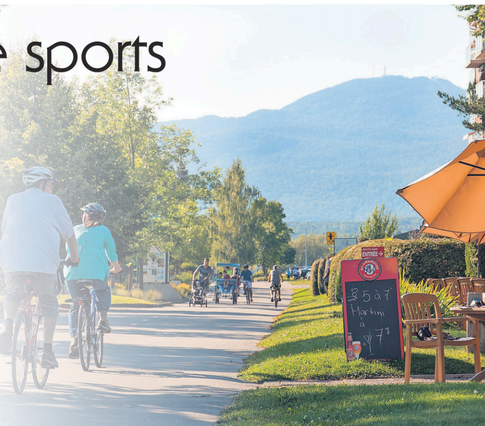
La Route verte, dont le tronçon «La Montagnarde», est un incontournable pour tous ceux qui pratiquent le vélo.

« GOLF ». Le nombre de terrains de golf à proximité est assez impressionnant. Que ce soit à Magog, au Canton d'Orford, au Canton de Potton ou encore à Stanstead, les golfeurs passeront assurément du bon temps. Il existe même un parcours considéré parmi les plus beaux de la planète, soit le Club de golf Memphrémagog. Mais ce terrain est réservé à une clientèle ultra-privée, d'une cinquantaine de membres riches.