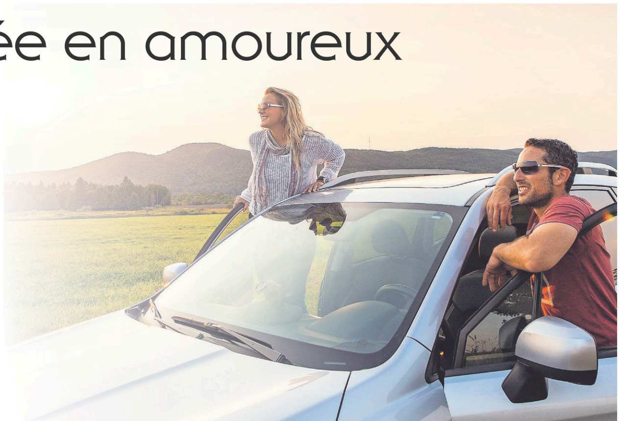
Une façon agréable de découvrir la région et ses magnifiques paysages est de se balader en voiture.

Mais vaut mieux s'équiper d'une carte ou d'un GPS, surtout en allant vers Stanstead ou le Canton de Potton. Puisque dans ces zones frontalières, prendre le mauvais chemin peut vous occasionner un mauvais quart d'heure avec les douaniers américains. Au besoin, traînez votre passeport.