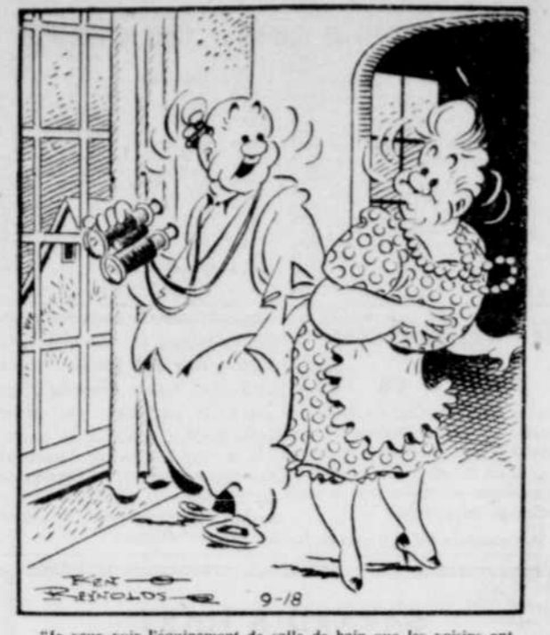
"Je veux voir l'équipement de salle de bain que les voisins ont acheté des Annonces Classées de la TRIBUNE!"

VOUS POUVEZ CHANGER VOS VIEUX MEUBLES POUR DES NEUFS TERMES FACILES, $1 DESIRE LE VIVROI ENR. 18, rue Saint-François Téléphone 3-2773