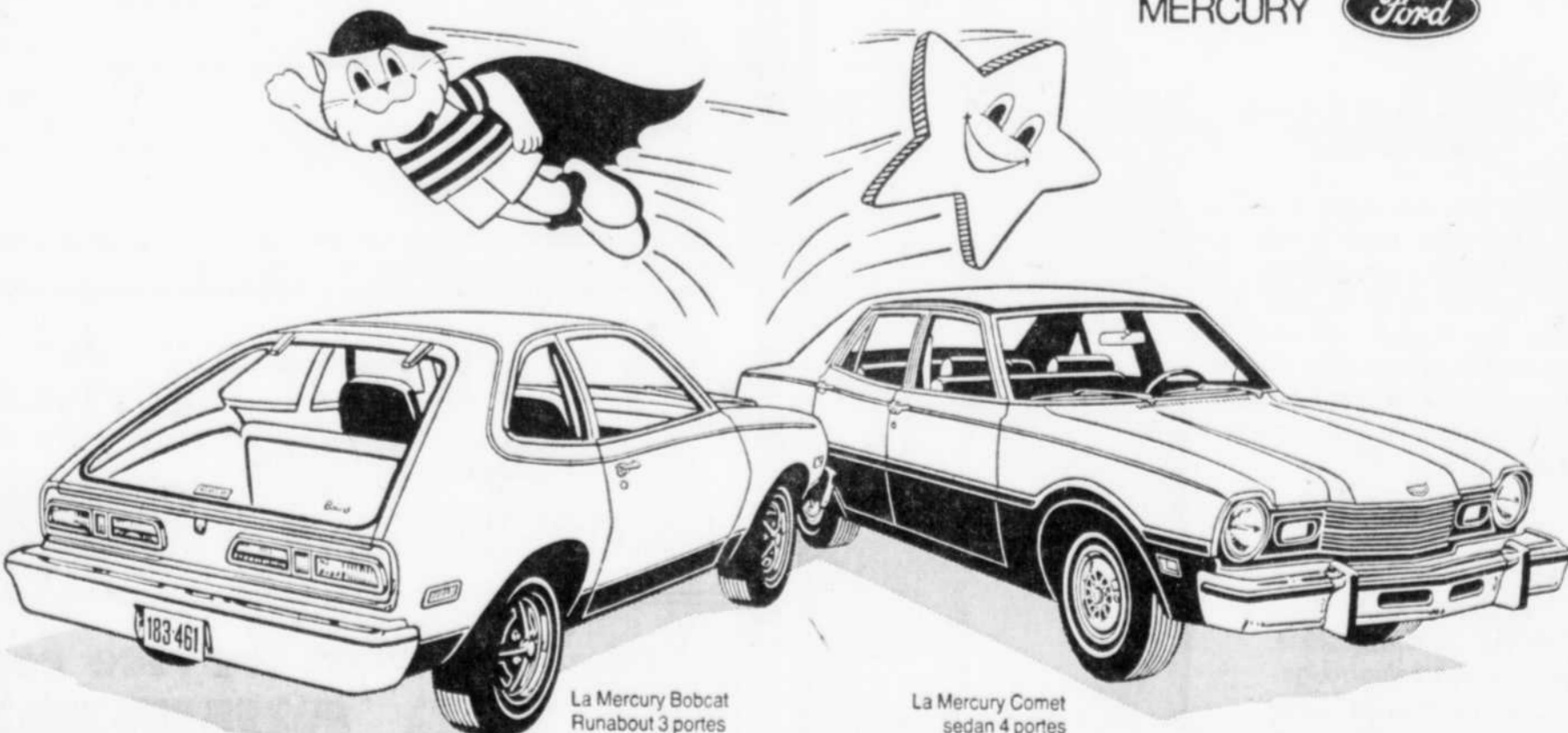
La Mercury Bobcat Runabout 3 portes