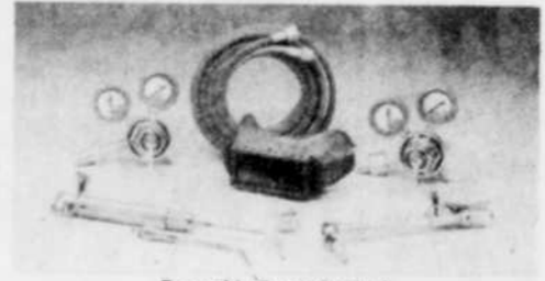
Ensemble Prest-O-Weld Difficile à battre pour les travaux d'entretien et de réparation en atelier. Prix courant: $355,00 Spécial $236,82