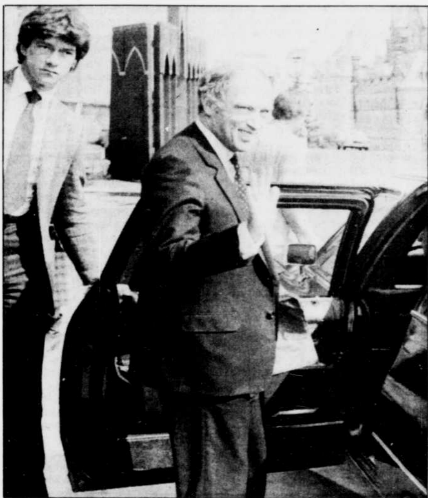
Le premier ministre Trudeau à sa sortie du Parlement, après l'annonce de l'adoption du Canada Bill en troisième lecture à la Chambre des lords, à Londres.

Selon Le Devoir, la visite de la reine sera précédée et suivie d'un véritable blitz publicitaire à la télévision, dans les stations de radio et dans les grands journaux du pays. L'opération baptisée "Coming Constitution Campaign" engloutira $7 millions des $25 millions de budget qu'a obtenu cette année le Centre d'information sur l'unité canadienne. Elle durera trois semaines.