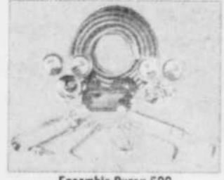
Ensemble Parox 500 Le meilleur ensemble qui soit pour les gros travaux de soudage, de coupe et de chauffage assésés. Prix courant: $195,00 Spécial $346,26