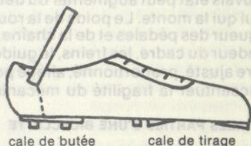
cale de butée cale de tirage